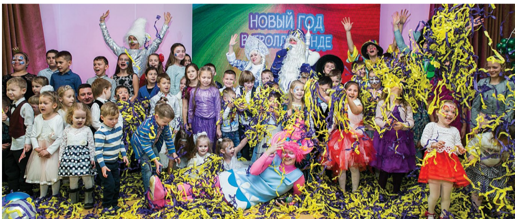
Праздник в АО «Газпром оргэнергогаз»

В компаниях холдинга ООО «Газпром центрремонт» уже стало доброй традицией проводить празднование Нового года для детей работников. Организаторы придумывают увлекательные театральные сюжеты, приглашают актеров в ярких костюмах, готовят подарки и угощения.