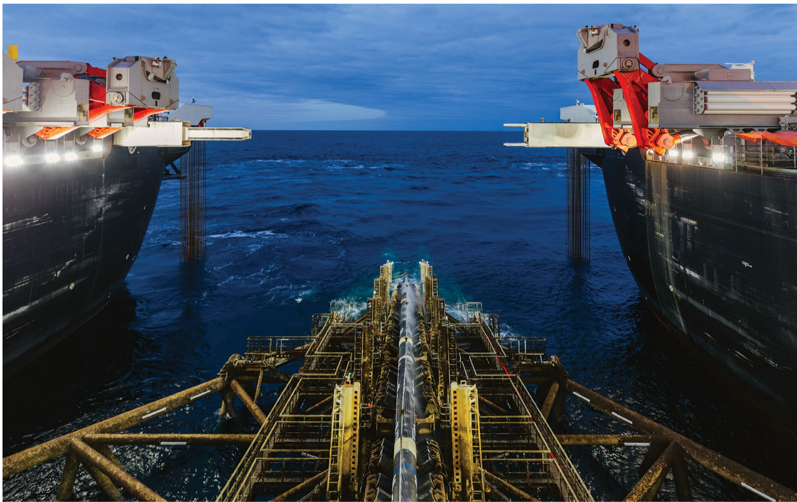
Трубоукладочное судно Pioneering Spirit на строительстве газопровода «Турецкий поток»

В ПАО «Газпром» подвели итоги реализации инвестиционных проектов в 2018 году. Масштабная работа велась на Бованенковском и Чаяндинском месторождениях, строились газопроводы «Ухта – Торжок – 2», «Северный поток – 2», «Турецкий поток», «Сила Сибири», а также СПГ-проекты, которые призваны укрепить энергетическую безопасность регионов России и зарубежных стран.