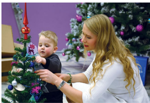
Украшение новогодней елки