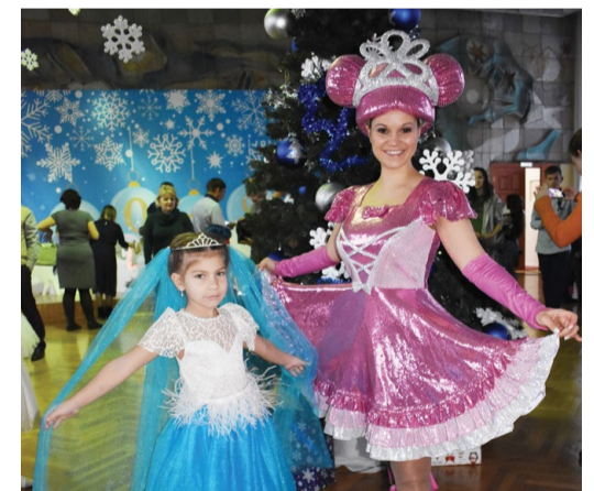
Фея ПАО «ТМ»

Детей развлекали сказочные герои, которые приготовили для них не только спектакль, но и творческие мастер-классы по различным техникам рисования. Кроме того, на утреннике подвели итоги детского