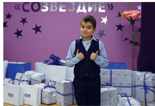
Подарки от волшебников «Газпром центрремонта»