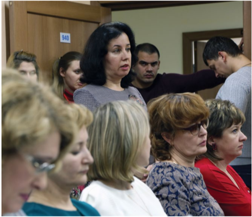
Вопросы работников предприятия