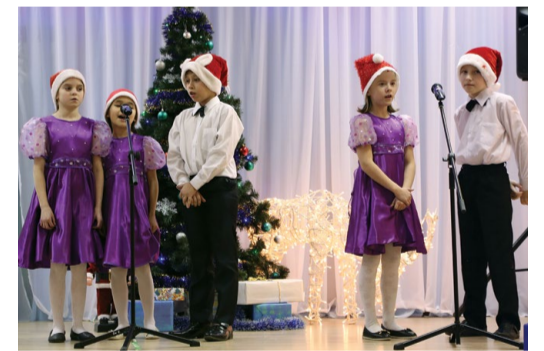
Выступление малышей Свирского детского дома