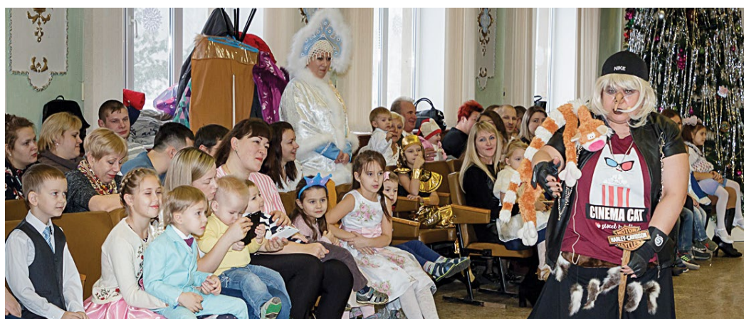
Представление на заводе «РТО»

Для них были приготовлены любимые лакомства – попкорн и мороженое. Художники по аквагриму создавали интересные образы, дети увлеченно украшали пирожные и собственноручно создавали нарядные новогодние рамки. Хороводы, конкурсы и викторины, фотографии с веселыми троллями – маленькие участники не скуцали ни одной минуты!