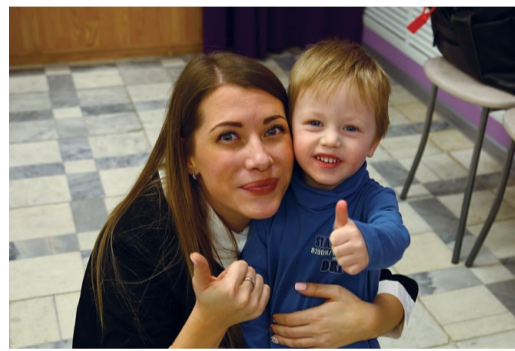
Знакомство с новыми друзьями