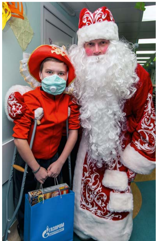
Подарки от сотрудников холдинга