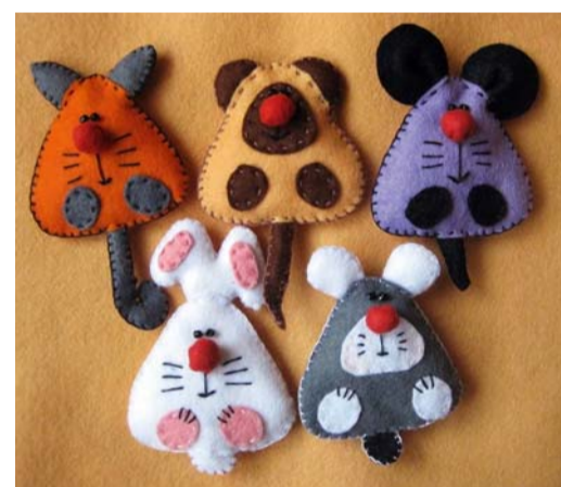
Украшения из ткани