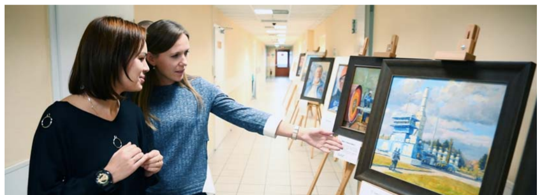
Сотрудники ОАО «Газэнергосервис» обсуждают многообразие цветов на КС «Белоусовская»