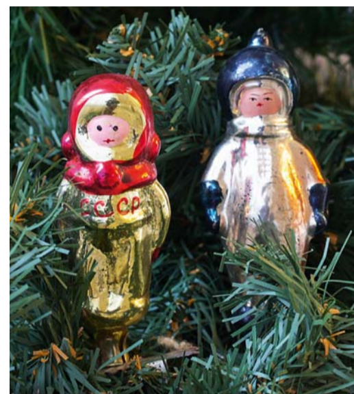
Игрушки в честь покорения космоса