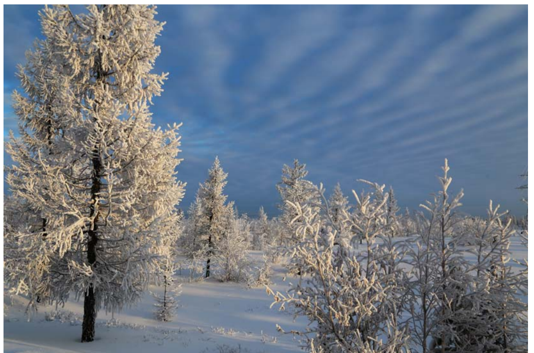
Игорь Мамай – «Белая сказка»