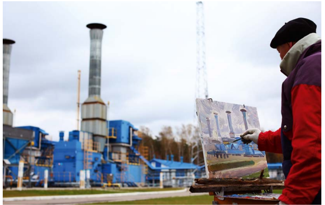
Щелковское подземное хранилище газа