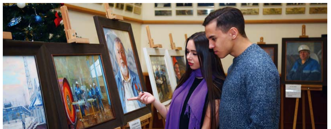
Студенты Губкинского университета