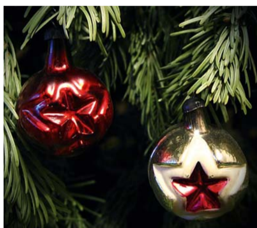
Звезды были в каждом доме