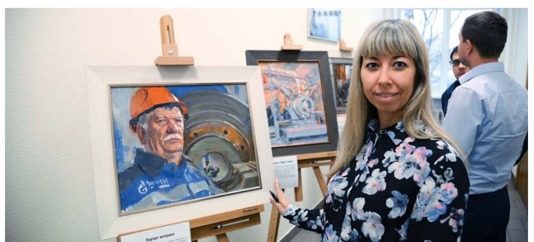
Выставка в АО «Газпром центрэнергогаз»