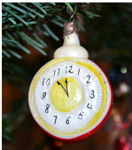
Часы из «Карнавальная ночь»

А при желании можно сделать украшения и самостоятельно, причем для этого сгодятся и подручные средства. Главное – фантазия и старание.