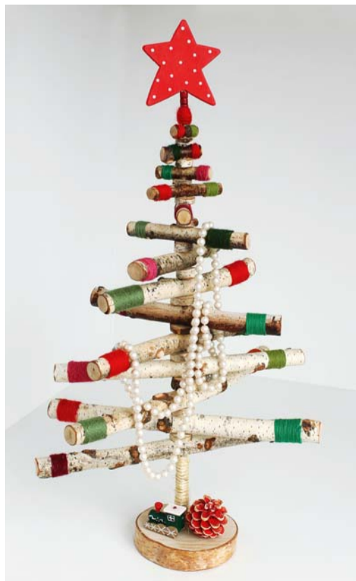
Самому можно сделать даже «елку»