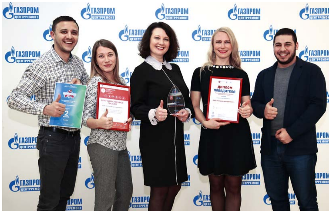
Организаторы донорского движения – сотрудники службы по связям с общественностью и СМИ

По итогам III Московского донорского марафона «Достучаться до сердец» компания «Газпром центрремонт» стала победителем