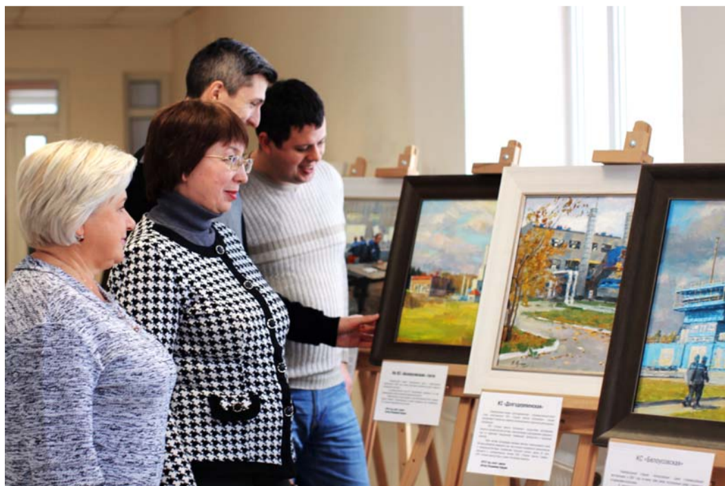
Работники Московского УПХГ