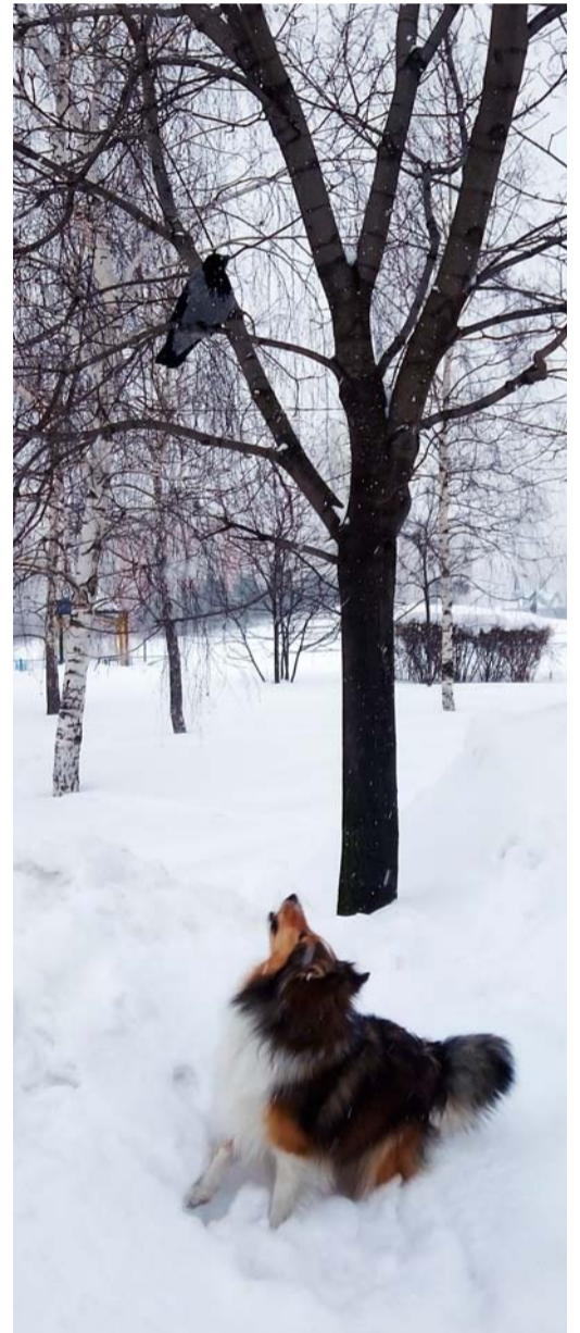
Игорь Лазарев – «На охоте»