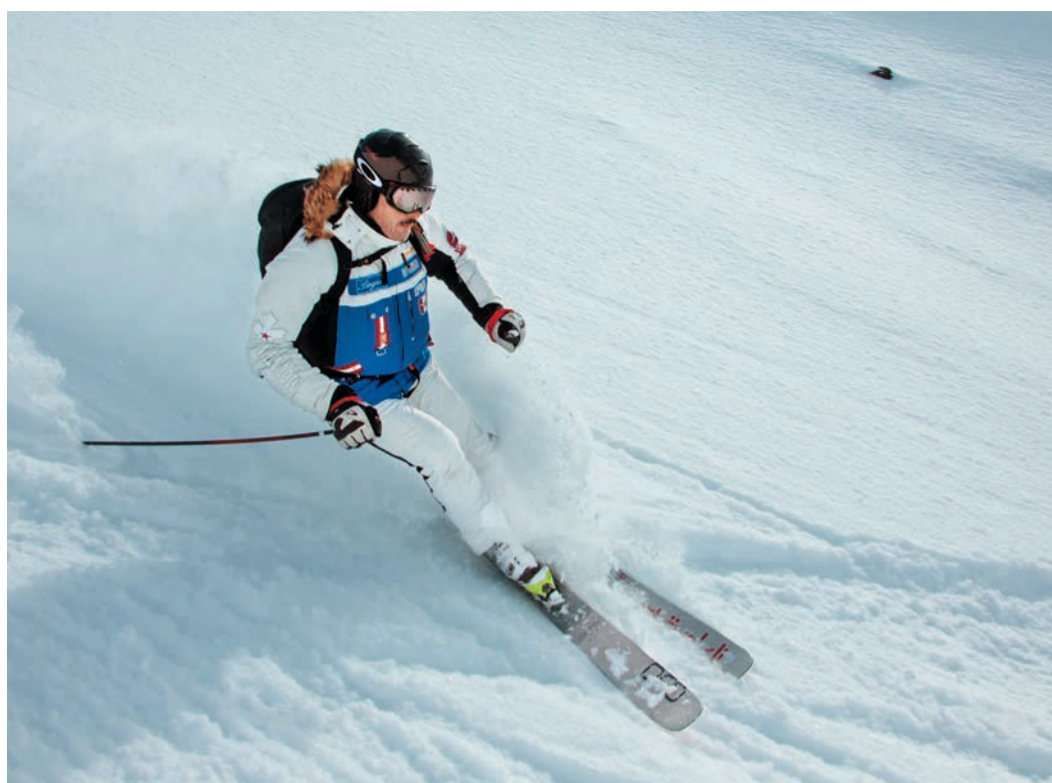
Во время покорения очередного спуска