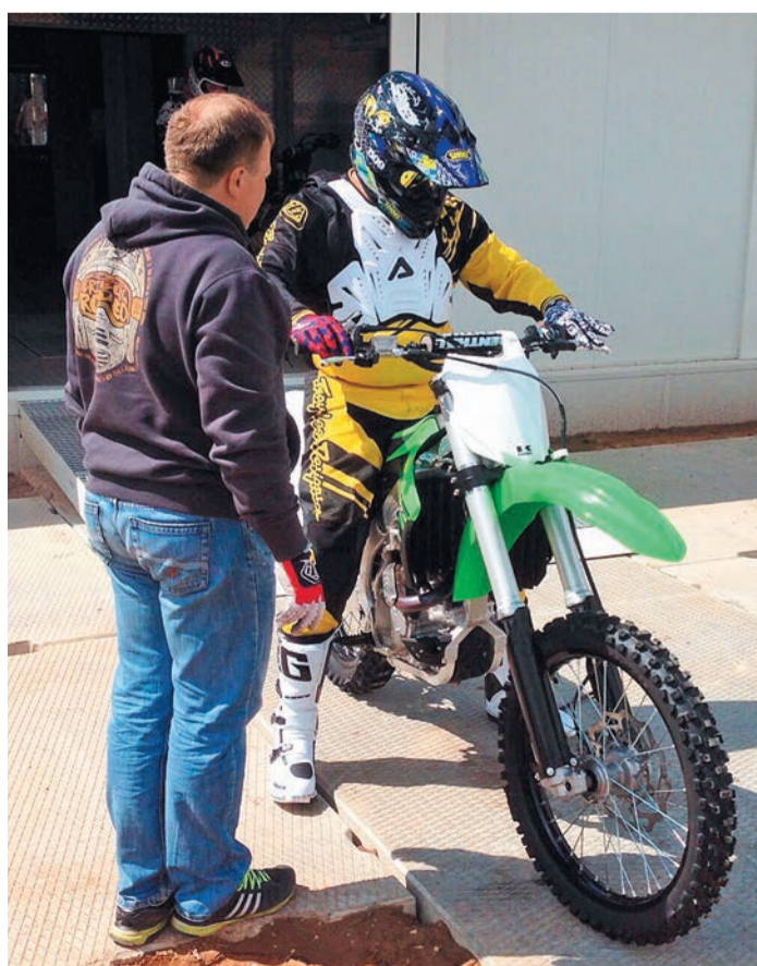
За минуту до старта