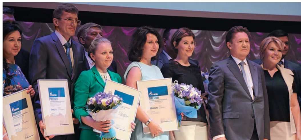
Председатель Правления ПАО «Газпром» Алексей Миллер и лауреаты конкурса

Общество с ограниченной ответственностью «Газпром центрремонт» стало лауреатом VII Корпоративного конкурса служб по связям с общественностью дочерних обществ и организаций ПАО «Газпром» по итогам работы в 2015 году. Торжественное награждение победителей конкурса состоялось 28 июня в центральном офисе ПАО «Газпром».