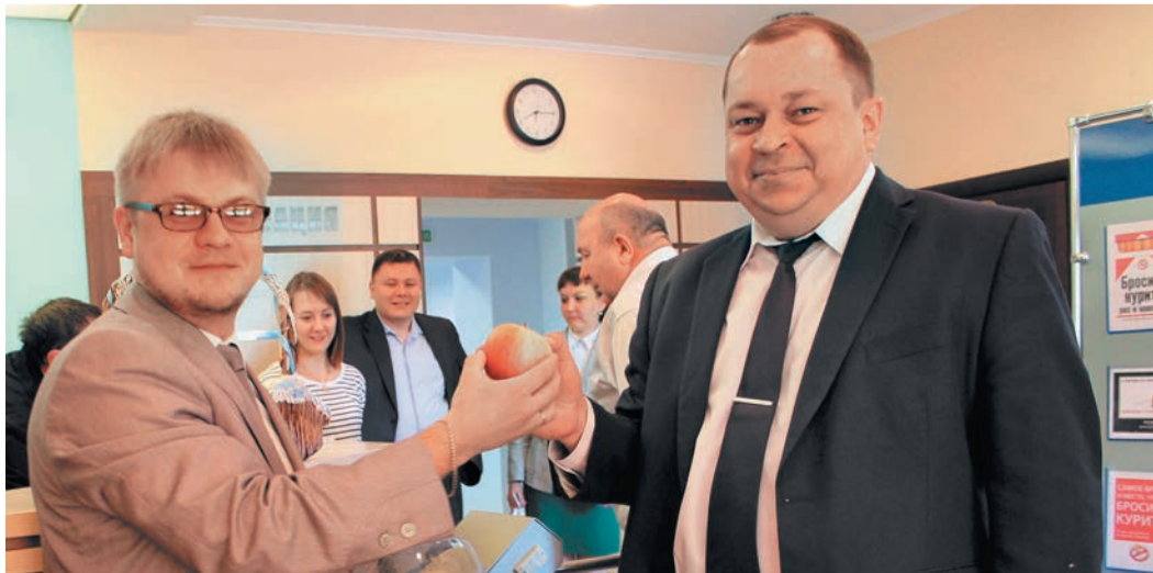
Газовики поддержали идею обмена сигарет на яблоки