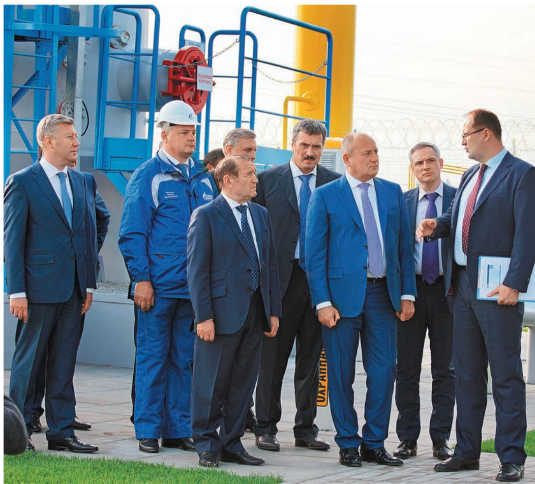
Торжественное открытие контрольно-распределительного пункта 16 после реконструкции