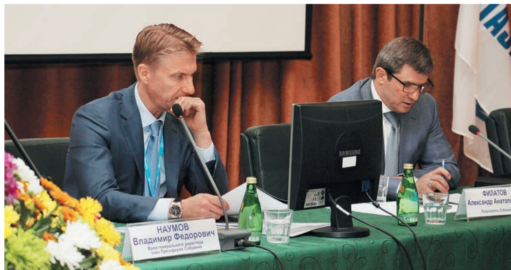
Президиум собрания в ОАО «Оргэнергогаз»

В июне в дочерних Обществах холдинга – компаниях АО «Тюменские моторостроители» и ОАО «Оргэнергогаз» – состоялись годовые Общие собрания акционеров. В ходе мероприятий были подведены итоги производственно-хозяйственной деятельности, утверждены годовые отчеты, бухгалтерская отчетность предприятий, определены перспективные направления развития компаний.