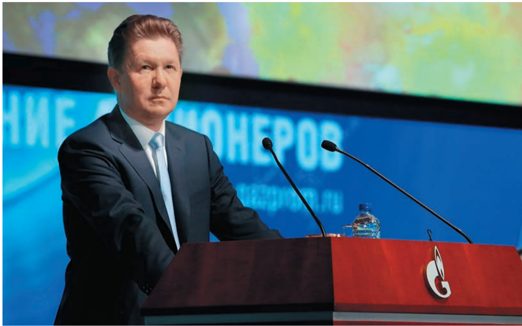
Выступление Алексея Миллера перед акционерами

Председателем Совета директоров ПАО «Газпром» избран Виктор Зубков, заместителем Председателя Совета директоров компании – Председатель Правления ПАО «Газпром» Алексей Миллер.