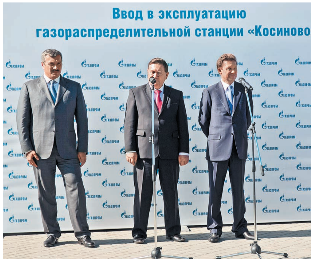
На торжественном открытии ГРС «Косиново» после реконструкции