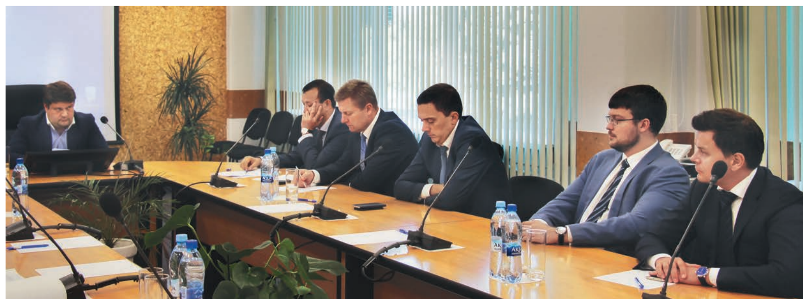
В ходе собрания акционеров в АО «Тюменские моторостроители»

Также важной задачей является разработка новых технологий для обеспечения высокого качества выполняемых работ и услуг и их активная реализация».