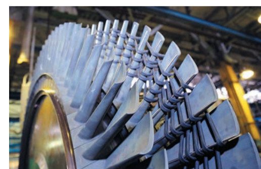
Лопатки осевого компрессора

гателей, а контроль и управление стендовыми системами легко адаптируется к испытаниям других типов двигателей (ДГ-90) и внедрению новых технологических систем.