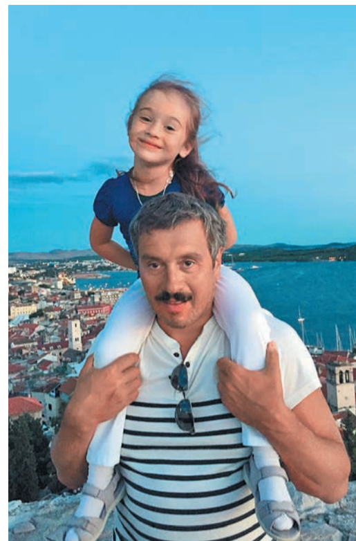
С дочерью на отдыхе