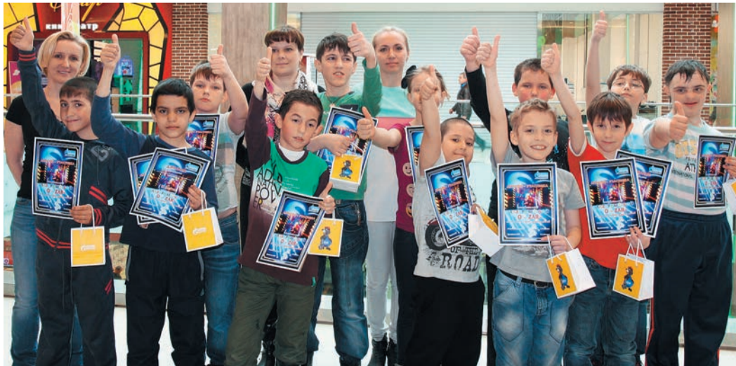
Улыбки детей – лучшая награда