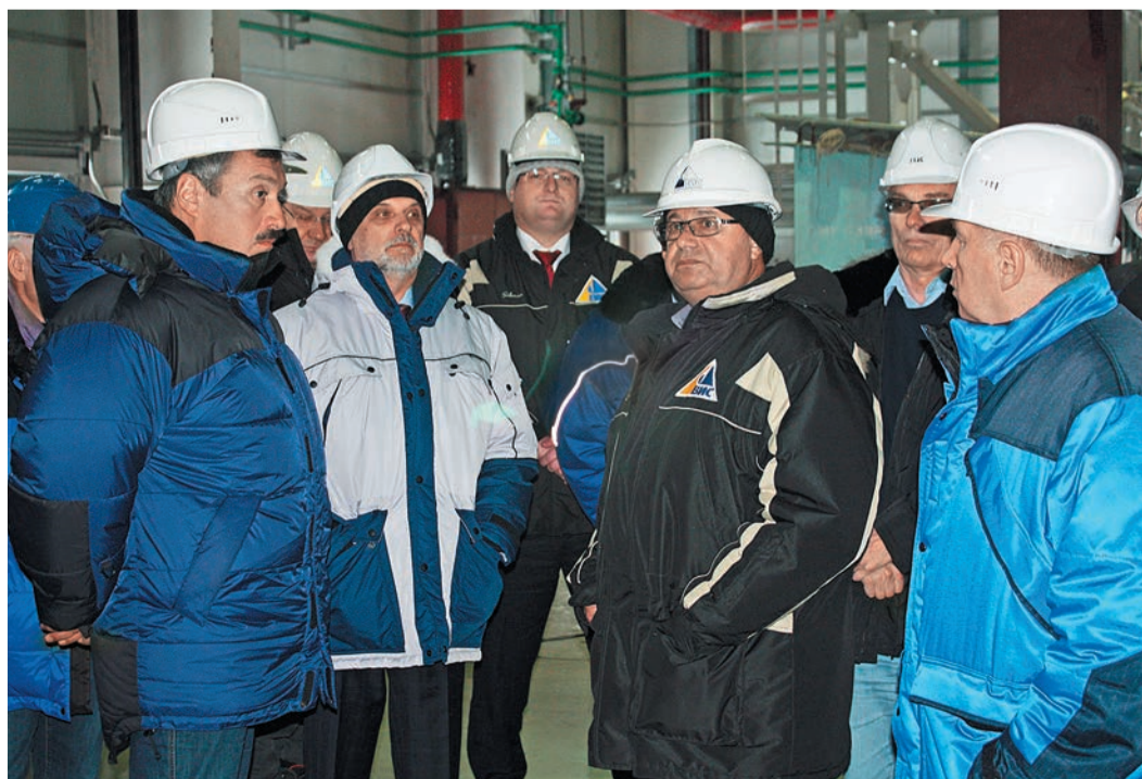
В рамках рабочего визита на строящийся Новоуренгойский газохимический комплекс

– Конечно, мне, как и всем, часто хочется, чтобы свободного времени было побольше. Но, в общем-то, времени хватает. Другой вопрос, что я не большой любитель театра. Обычно освобождаюсь после работы довольно поздно, никак не раньше девяти – начала десятого. Какое-то время уходит на то, чтобы поиграть с младшей дочкой... Словом, до премьер дело доходит нечасто. В общем, расписание, в котором мы все живем, я считаю нормальным. Мы к нему давно привыкли, и я лично не вижу в таком ритме жизни никаких проблем для себя.