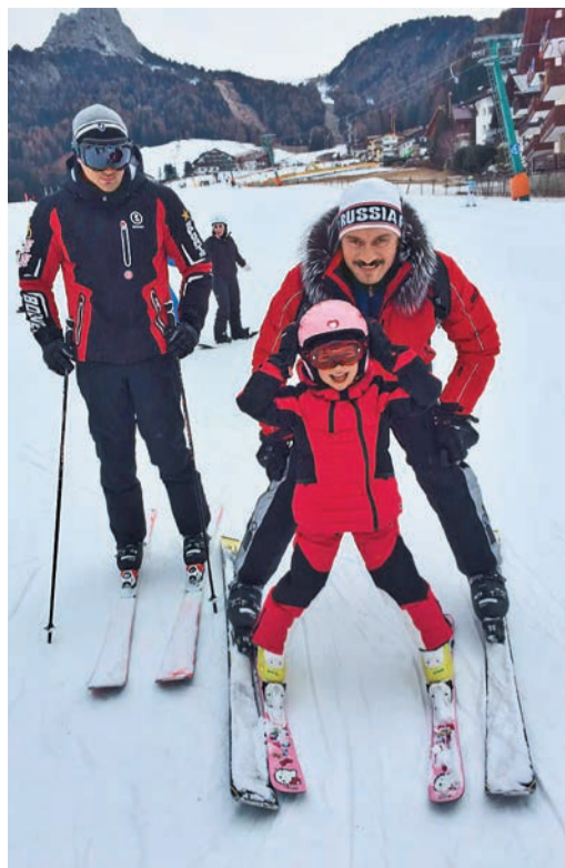
Команда умелых лыжников. С сыном и дочерью

Крепкого вам здоровья, неиссякаемой энергии и плодотворной деятельности!