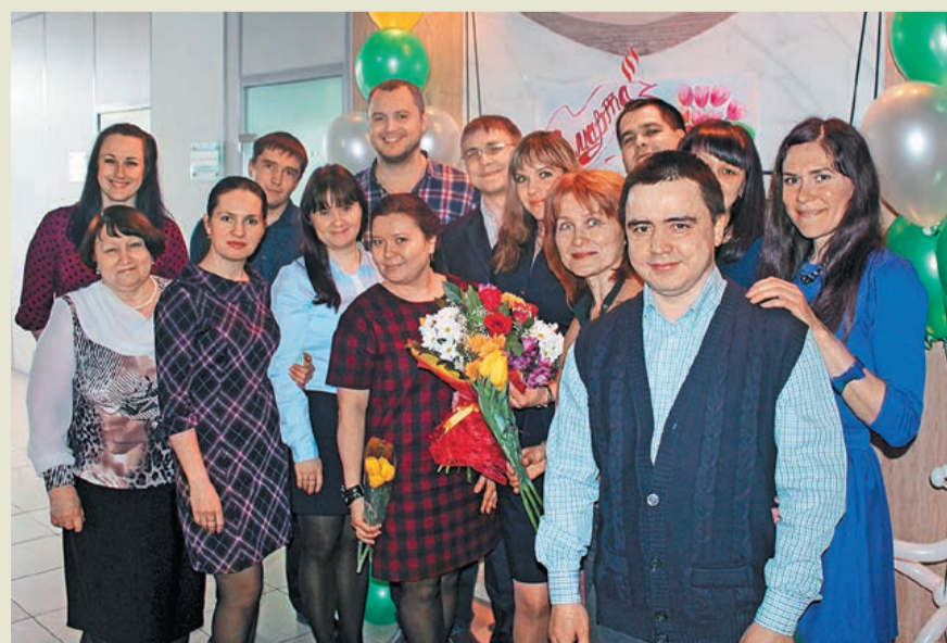
В преддверии праздника в ПНИ ОАО «Газтурбосервис»