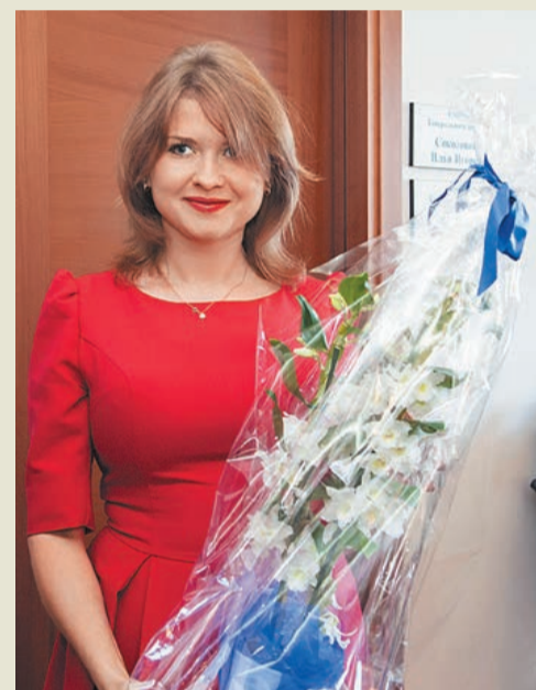
Главный подарок – отличное настроение!