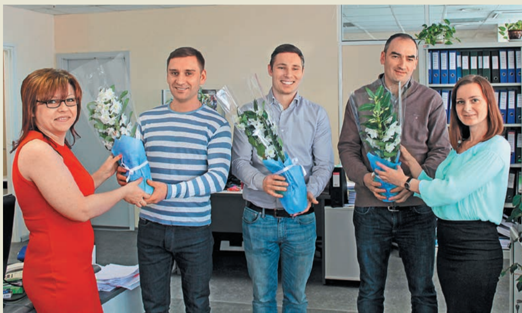
Поздравление любимых коллег в центральном офисе ОАО «Газэнергосервис»