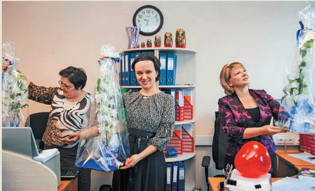
Без подарка не осталась ни одна сотрудница ООО «Газпром центрремонт»

настроением на весь год до следующего 8 Марта. Кроме этого, мужчины холдинга традиционно готовят оригинальные приятные сюрпризы и творческие подарки своим коллегам – милым дамам. Самые яркие моменты праздника запечатлены в фоторепортаже праздничного выпуска корпоративной газеты.