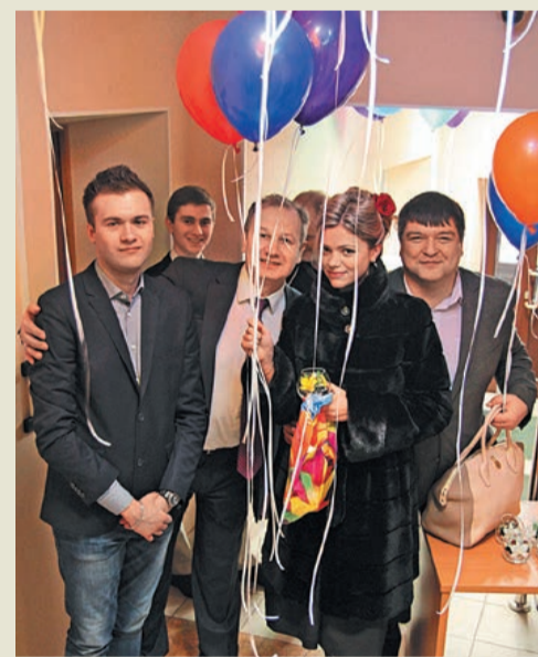
Праздник в ОАО «Оргэнергогаз»