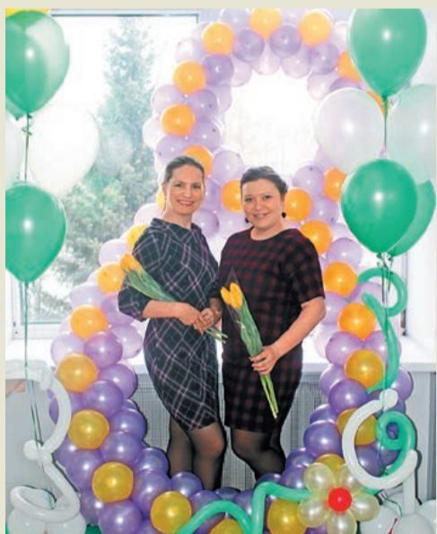
8 Марта с улыбками на лицах!