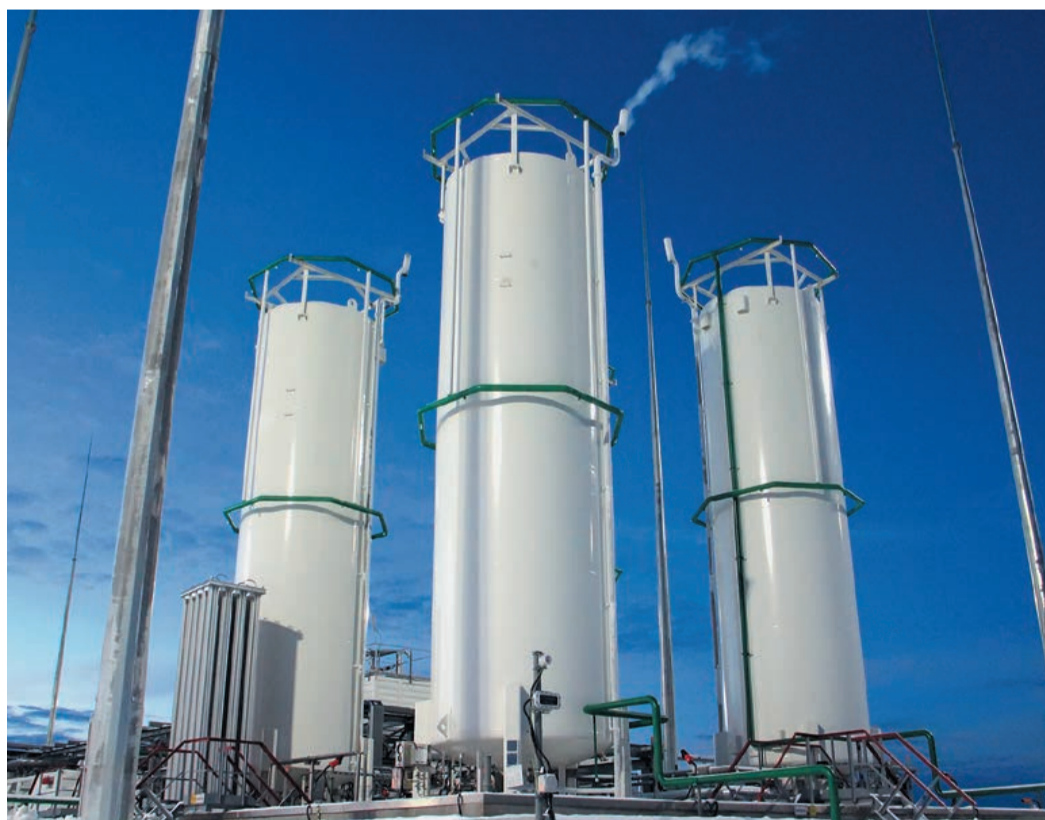
Мини-завод по производству СПГ

Открывая совещание, Валерий Голубев отметил, что сокращение транспортных расходов является одним из наиболее действенных инструментов повышения эффективности производства российского валового внутреннего продукта (ВВП). В то же время сегодня только 0,2% (около 100 тыс. единиц) отечественного автотранспорта используют самый экономичный и экологичный вид моторного топлива – природный газ. «Газпром» ведет масштабную системную работу по расширению использования сжатого природного газа в качестве моторного топлива. В перспективе компания планирует широко применять не только сжатый, но и сжиженный природный газ (СПГ). Речь идет, прежде всего, о крупнотоннажном автомобильном и железнодорожном транспорте.