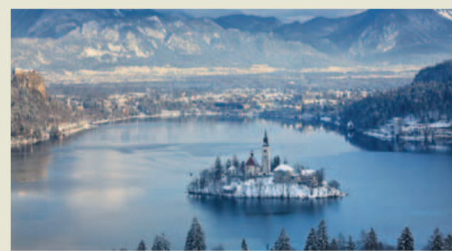
Остров Блед. Словения.

Все, кто хотел бы задать вопрос психологу или получить анонимную консультацию на страницах нашей газеты, могут обратиться по адресу: pr@gcr.gazprom.ru