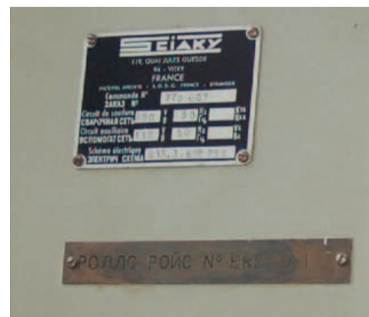
На шильдике французского станка – текст по-русски