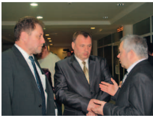
«Прения» в кулуарах