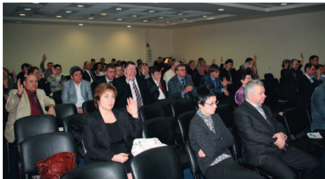
Голосование по принятию постановления