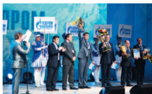
Вручение кубков чемпионам зимней Спартакиады ОАО «Газпром»

Участники взрослой Спартакиады состязались в таких видах спорта, как лыжные гонки, биатлон (зимнее троеборье), настольный теннис, пулевая стрельба и мини-футбол. Юные спортсмены участвовали в соревнованиях по хоккею с шайбой, мини-футболу, настольному теннису, лыжным гонкам. Первое место на IX взрослой Спартакиаде завоевала команда ООО «Газпром трансгаз Екатеринбург», второе – команда ООО «Газпром трансгаз Югорск», третье – команда ООО «Газпром трансгаз Нижний Новгород». По итогам соревнований IV детской зимней Спартакиады обще-