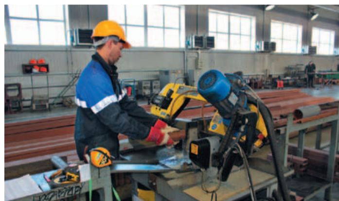
Рабочее место на заводе «Афипэлектрогаз»