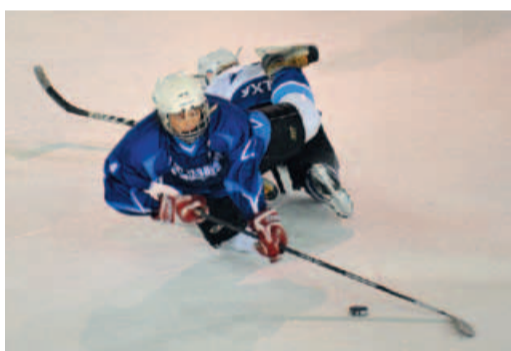
Во время игры

4 марта на закрывающей спартакиады церемонии победителей и гостей соревнований по-