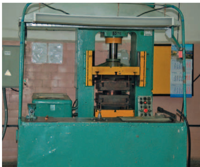
63-тонный пресс для изготовления РТИ

Я работаю на ЦРМ с октября 1981 года и застал начальный этап. В производственном цехе до сих пор работают английские станки и другое оборудование, поставленное в начале 80-х. Установив все это и наладив, англичане еще долго потом приезжали к нам, проверяли настройки, калибровали манометры. В свое время «Газпром» планировал здесь открыть площадку по ремонту двигателей судового типа производства украинского завода «Зоря-Машпроект», но не получилось: площади производственных помещений оказались недостаточно большими.