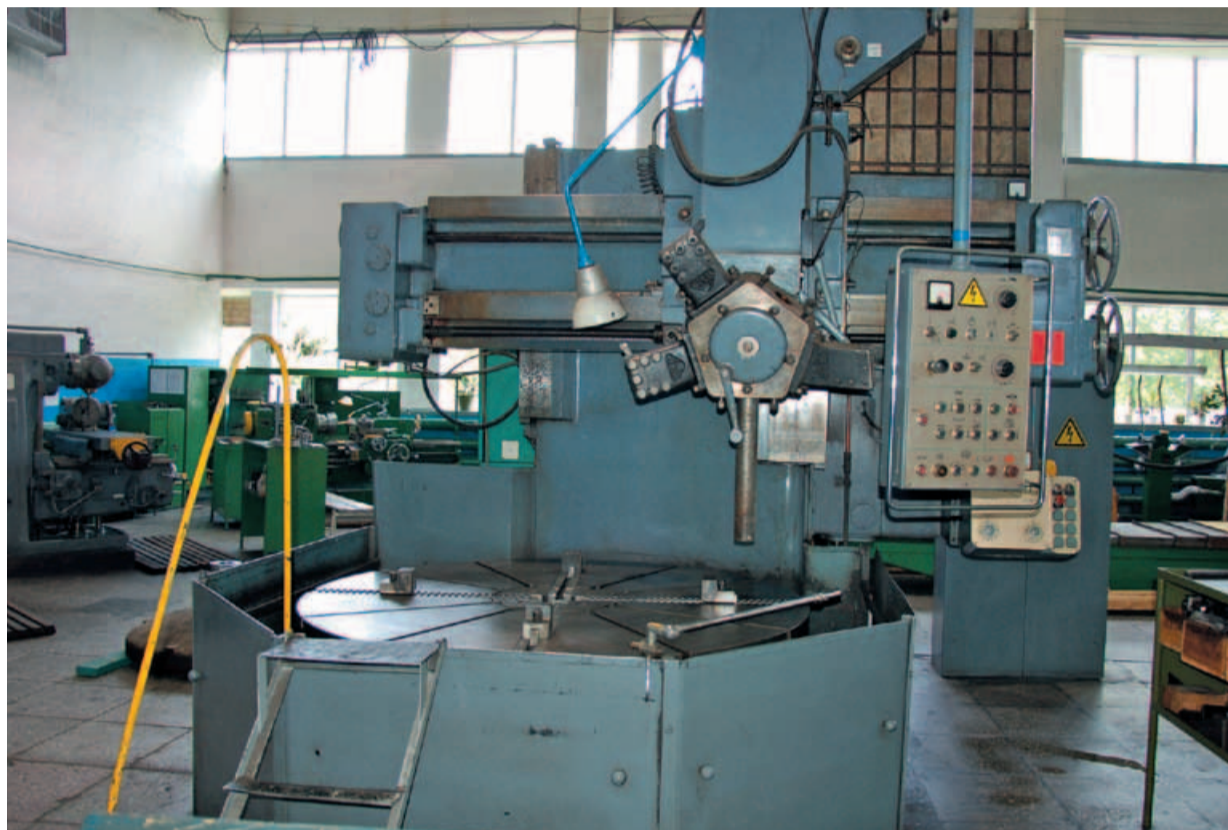
Токарно-карусельный и координатно-фрезерный английские станки, переехавшие из Антипина