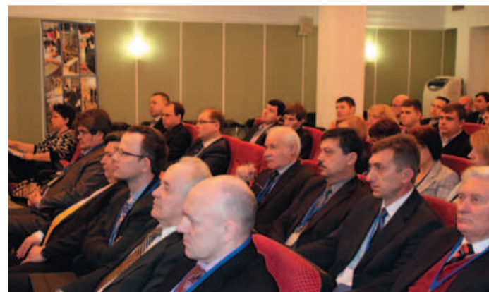
Гости конференции – главные энергетики ОАО «Газпром»