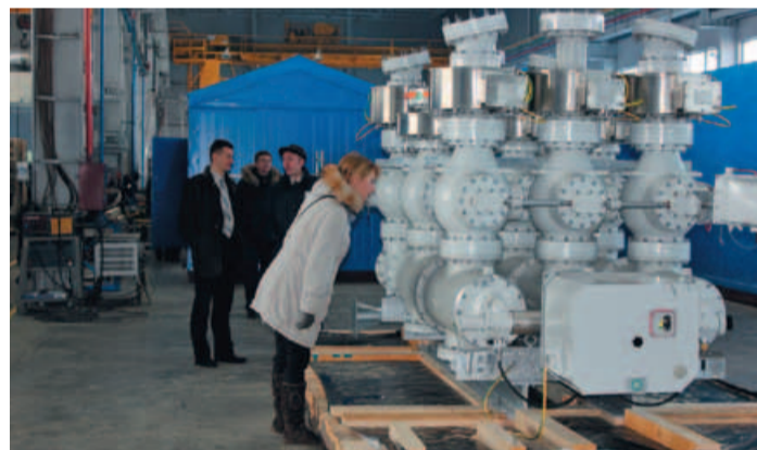
Экспозиция продукции ДООАО «Электрогаз»