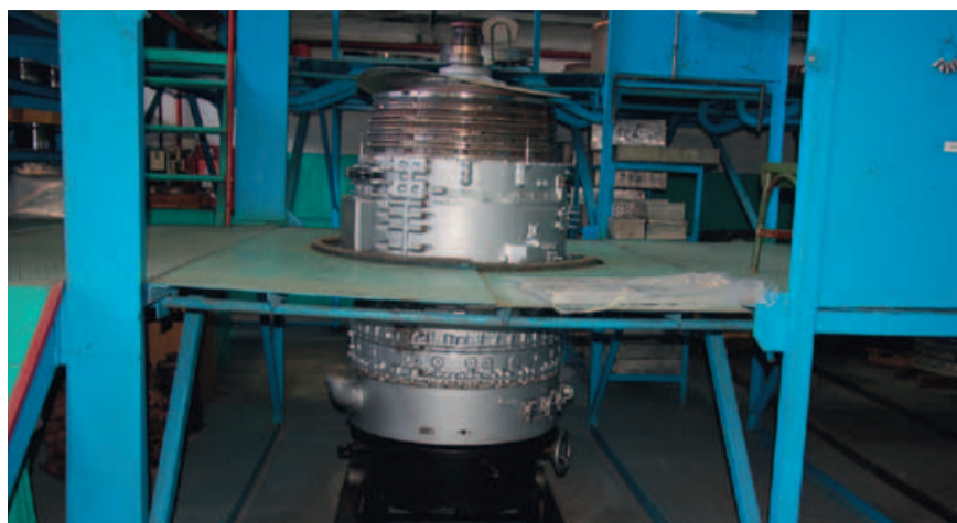
Сборку отремонтированного агрегата облегчает перемещение узлов по специальным рельсам

В Англию поначалу ездило руководство – для заключения договоров. Потом, когда начался ремонт, на заводы RR в Ковентри и Абердин поехали слесари и технические специалисты. Они осваивали производственные процессы и учились заказывать запчасти. К нам англичане тоже приезжали, но еще чаще навевались специалисты СКБ «Брянскгазэнергоремонт». База с «эй-вонами» на стапелях была идеальной площадкой для освоения технологий импортозамещения.