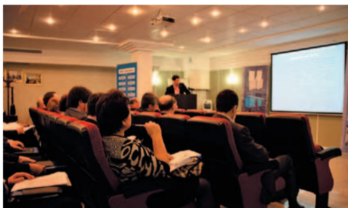
Один из 19 докладов конференции