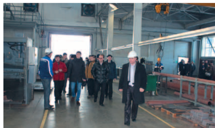
Экскурсия по цехам и территории завода «Афипэлектрогаз»