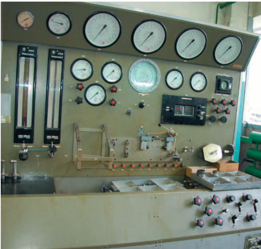
Английский стенд настройки и испытаний силового цилиндра и клапанов отбора воздуха

КОНСУЛЬТАЦИИ ПСИХОЛОГА. СЕМЬЯ И РАБОТА В ЖИЗНИ ЖЕНЩИНЫ стр. 8