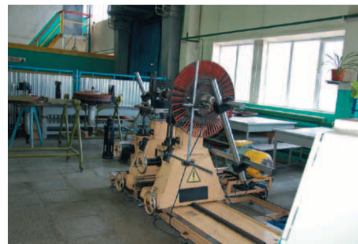
Балансировка ротора компрессора