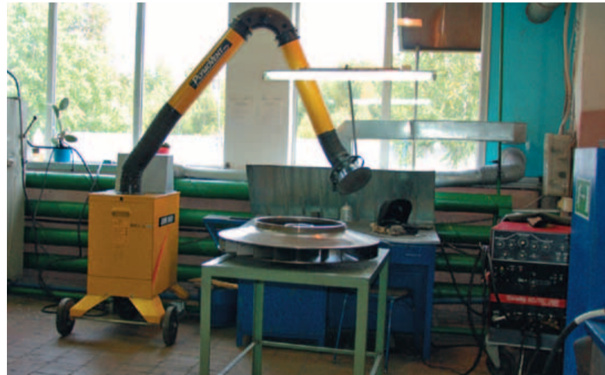
На переднем плане – ступень осевой турбины. На заднем - электростатический фильтровентиляционный агрегат ЕМК-1400 и аппарат для аргодуговой сварки