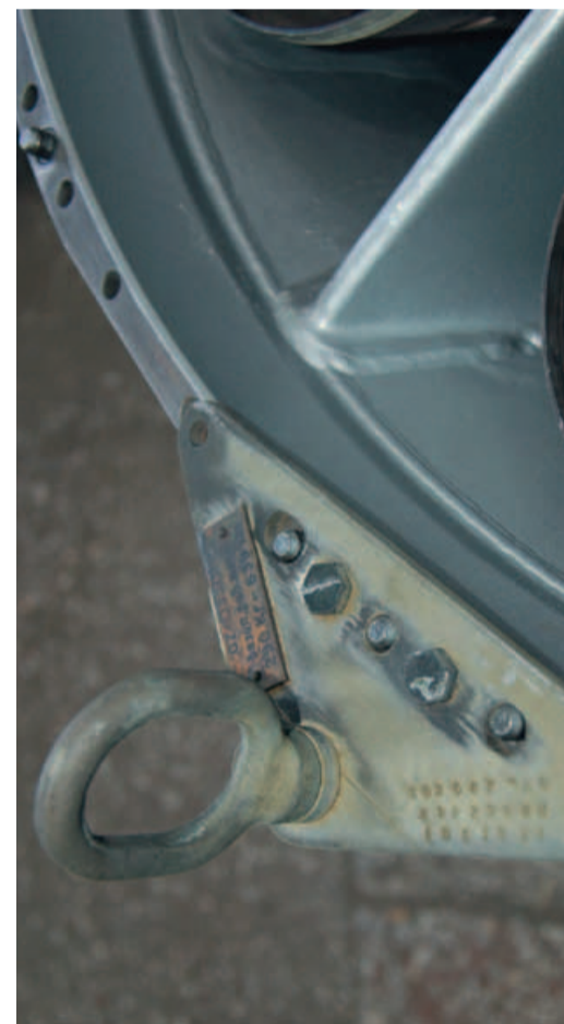
Ремонтное приспособление, изготовленное в Англии