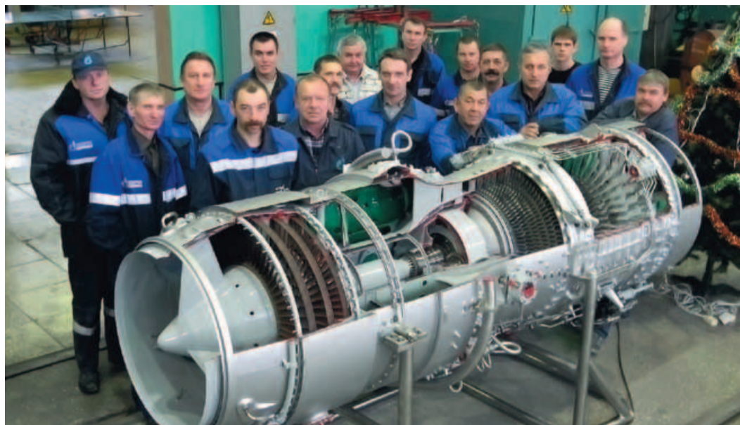
Макет Avon и коллектив сотрудников БЦРМ