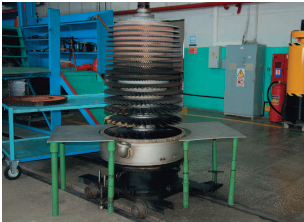
Ротор осевого компрессора пришел в ремонт