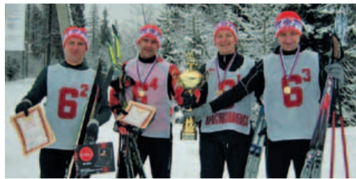
Команда ДАО «Электрогаз»

25 февраля Координационный совет профсоюзных организаций предприятий, входящих в холдинг ООО «Газпром центрремонт», провел в городе Краснознаменске Московской области лыжную эстафету на призы ГЦР. В сложных погодных условиях на городской лыжной трассе мужские команды соревновались в формате 4 x 4,5 км, а женские – 4 x 2,5 км.