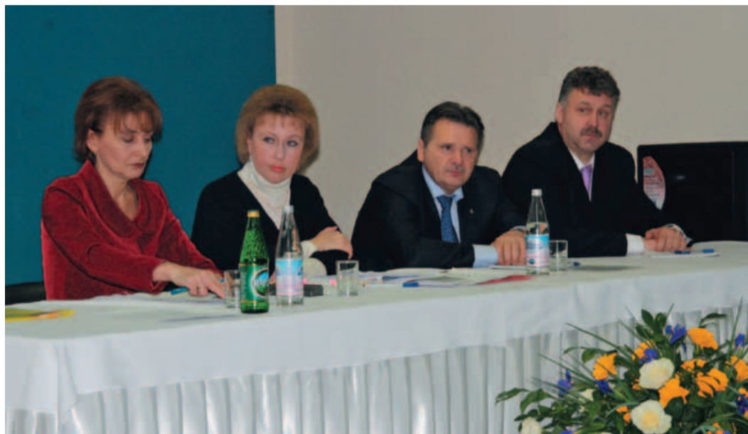
Президиум конференции работников ДООАО «Центрэнергогаз» ОАО «Газпром»