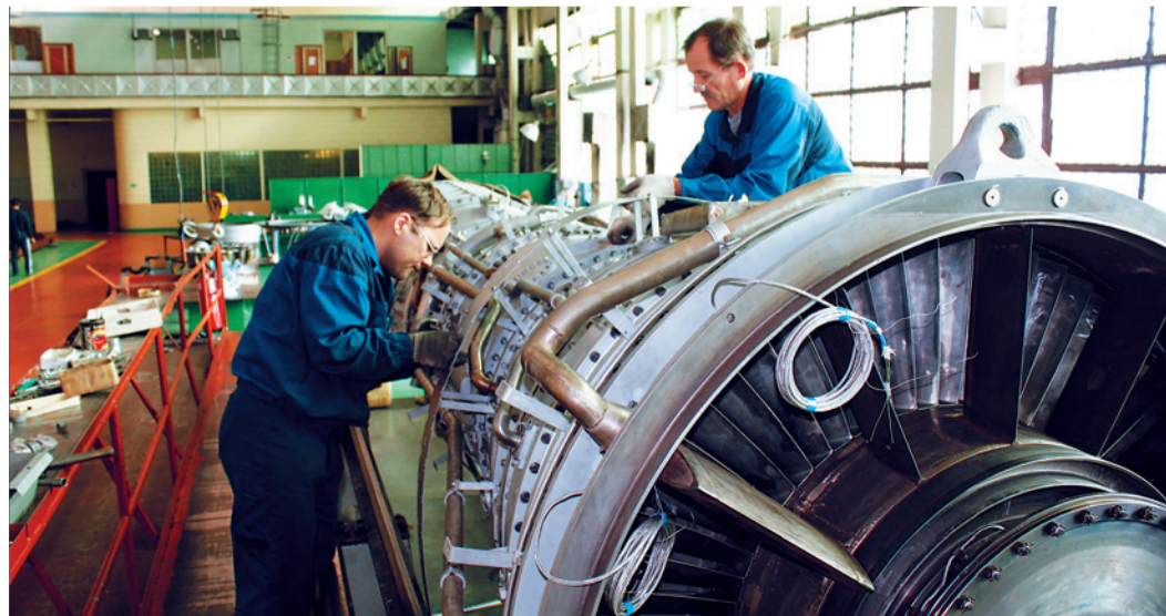
Процесс сборки газотурбинного двигателя

В следующем году мы планируем реализовать еще более 30 проектов по реконструкции КЦ и ГПА, ПХГ, ГРС и магистральных газопроводов, объектов систем автоматического