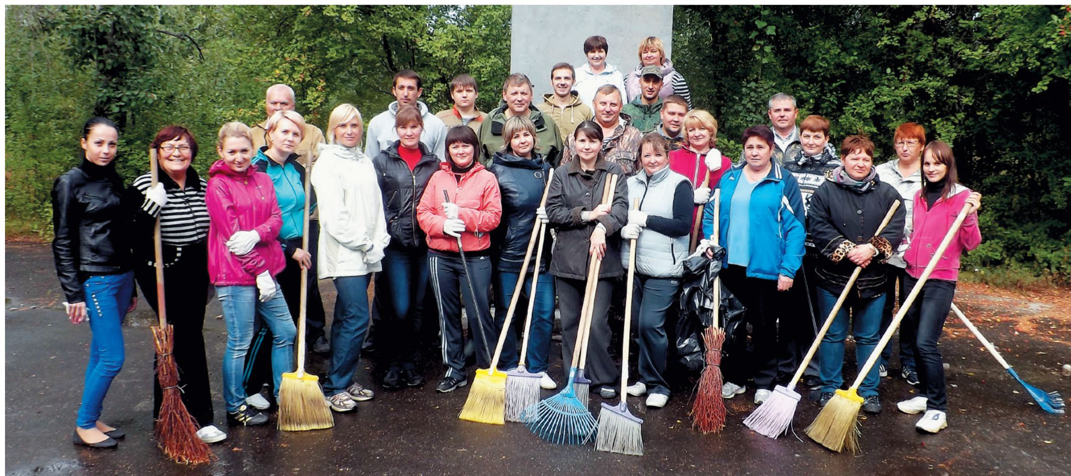
Тюменские моторостроители: и в дождливую погоду – с хорошим настроением

Благодаря экологической акции, каждый сотрудник предприятий холдинга ООО «Газпром центрремонт» имел возможность внести свой вклад в дело охраны окружающей среды.