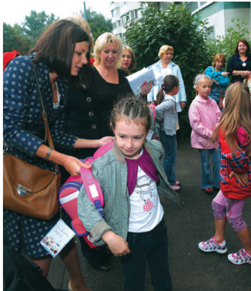
Вручение подарков от сотрудников ООО «Газпром центрремонт» и ДОО «Центрэнергогаз»