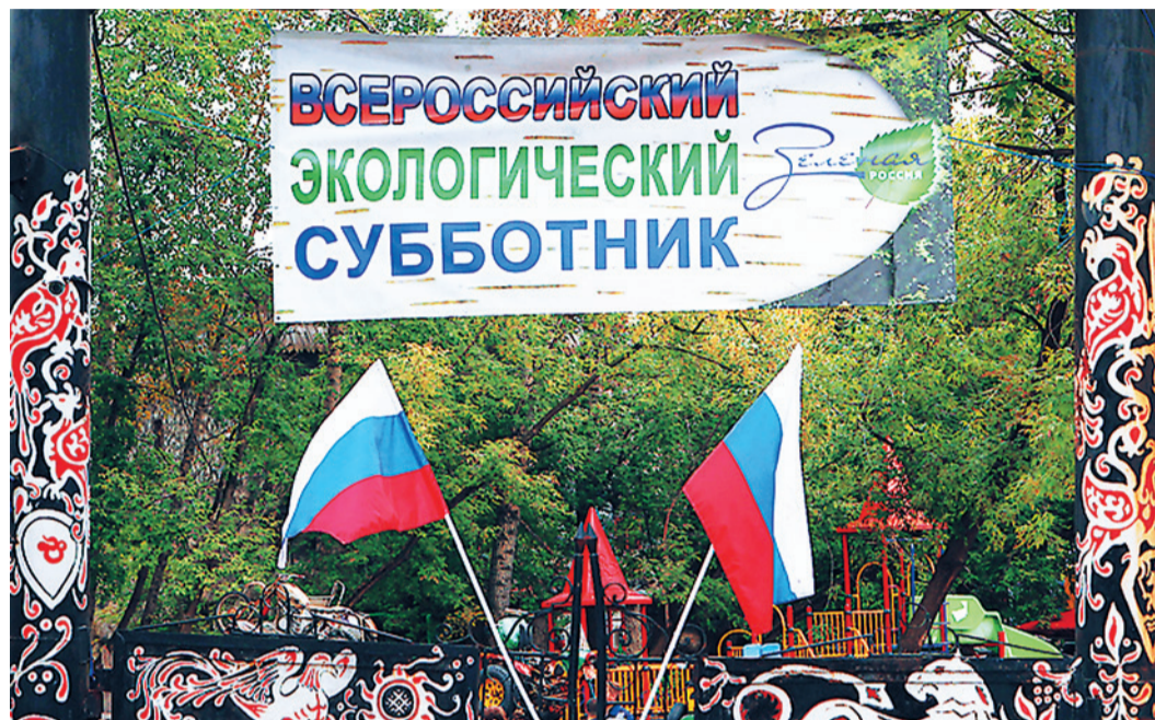
Экологический субботник объединил страну