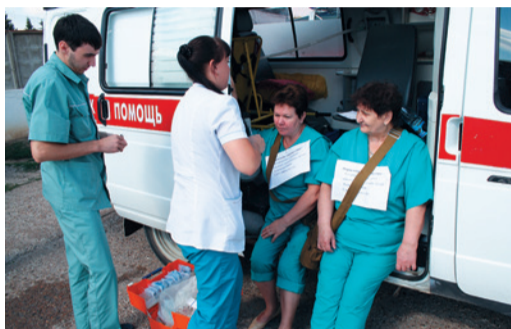
Оказание медицинской помощи «пострадавшим»

В ходе тренировки была приведена в действие работа формирования гражданской защиты завода с использованием современных средств индивидуальной защиты и имущества