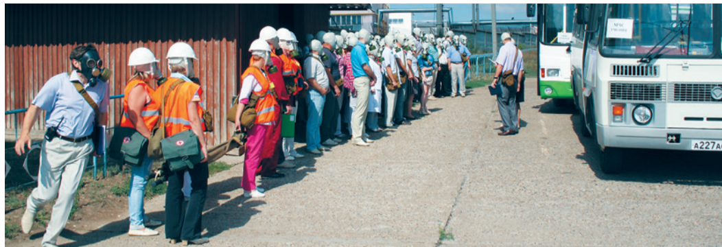
Эвакуация сотрудников завода «Ротор»

В конце лета на заводе «Ротор» – филиале ОАО «Газэнергосервис» был проведен учебно-методический сбор с работниками постоянно действующих органов управления системы гражданской защиты.