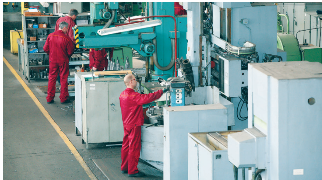
Производственные мощности предприятий холдинга