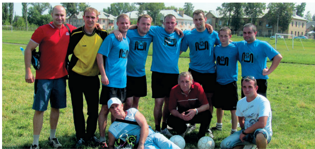
Команда завода «РТО» по футболу