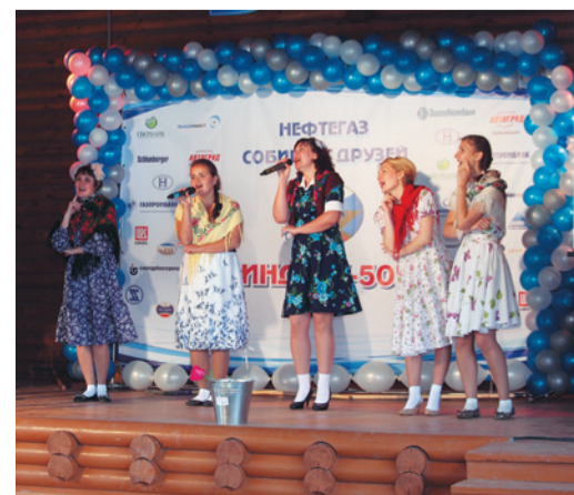
Выступление команды моторостроителей в конкурсе одной песни