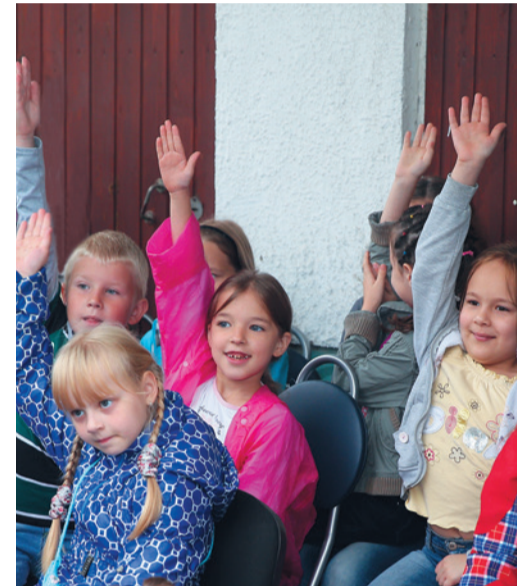
Будущие первоклашки репетируют первый урок