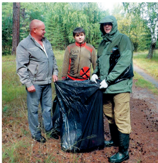
В Тюменской области активисты собрали десятки мешков мусора

По инициативе профсоюзной организации более 70 сотрудников ОАО «Тюменские моторостроители», разделившись на команды, произвели санитарную очистку прибрежной зоны вдоль озера Андреевского и территории базы отдыха «Звёздный». Участники акции также убрали бытовые отходы, оставленные отдыхающими