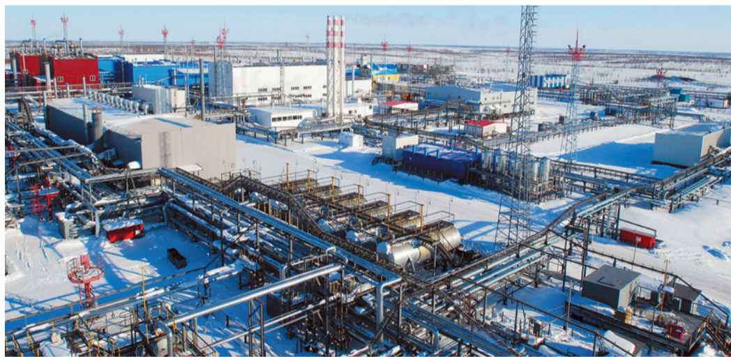
Промысел Заполярного месторождения

Чтобы обеспечить рост добычи в соответствии с прогнозными потребностями в газе, «Газпром» инвестирует значительные средства в поиск и освоение новых месторожде-