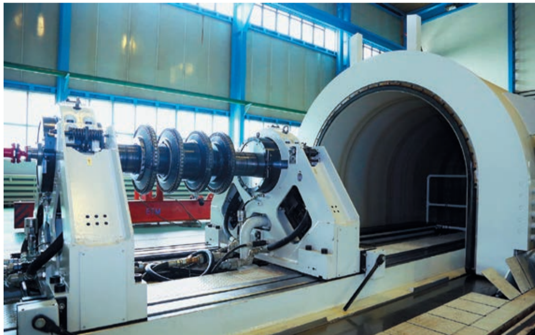
Разгонно-балансирующий стенд. Завод «Турборемонт»

газоперекачивающих агрегатов, используемых на магистральных газопроводах «Газпрома». На сегодняшний день предприятием произведен заводской ремонт около 700 роторов турбин ГПА отечественного и импортного производства. На данный момент одним из основных направлений деятельности завода «Турборемонт» является капитальный ремонт сменных проточных частей компрессоров и нагнетателей. Также завод выпускает нестандартное оборудование, высокоточный режущий инструмент и муфты для ремонта подводных переходов магистральных газопроводов.