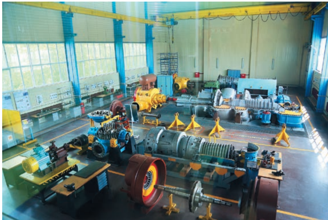
Учебный полигон Центра обучения кадров АО «Газпром центрэнергогаз»

Помимо этого, в Брянске также располагается филиал ОАО «Газэнергосервис» – завод «Турборемонт», еще одно предприятие в составе холдинга ООО «Газпром центрремонт», которое специализируется на изготовлении запасных частей и ремонте узлов