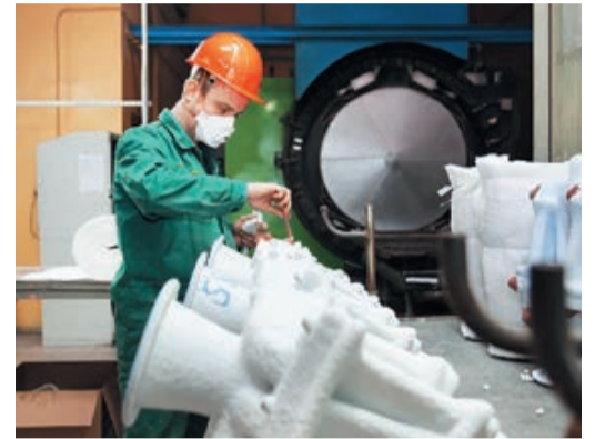
Создание надлежащих условий труда – в приоритете

и периодические заседания Рабочей группы по системе экологического менеджмента.