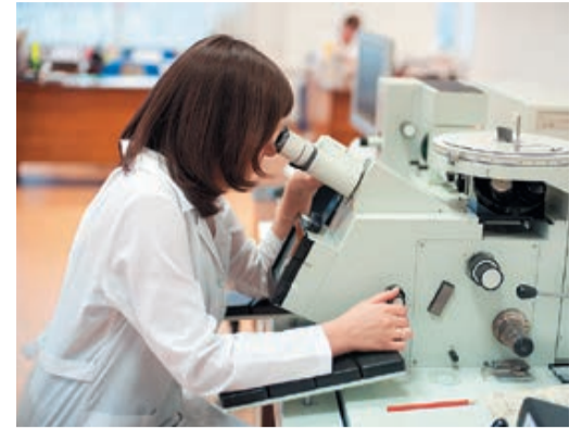
В лаборатории завода «Тюменские моторостроители»

Принятые обязательства реализуются в Обществе при заключении договоров с подрядными организациями, при согласовании проектной документации и при выявлении нарушений в процессе технических аудитов и производственного экологического контроля в отношении подрядных организаций. Также ведутся регулярное обучение персонала по вопросам экологической безопасности