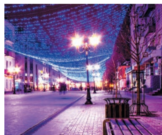
Брянск, бульвар Гагарина.