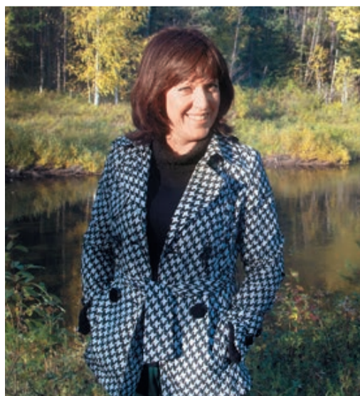
Во время командировки в Специализированное управление «Североразнэнергогаз». Ухта, 2009 год