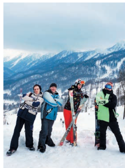
Спортсмены ООО «Газпром центрремонт»

Эмоциональную «копилку» сотрудников Общества дополнили впечатления от церемонии открытия III зимних Всемирных военных игр. Многие из наших коллег-спортсменов с удовольствием наблюдали за лыж-