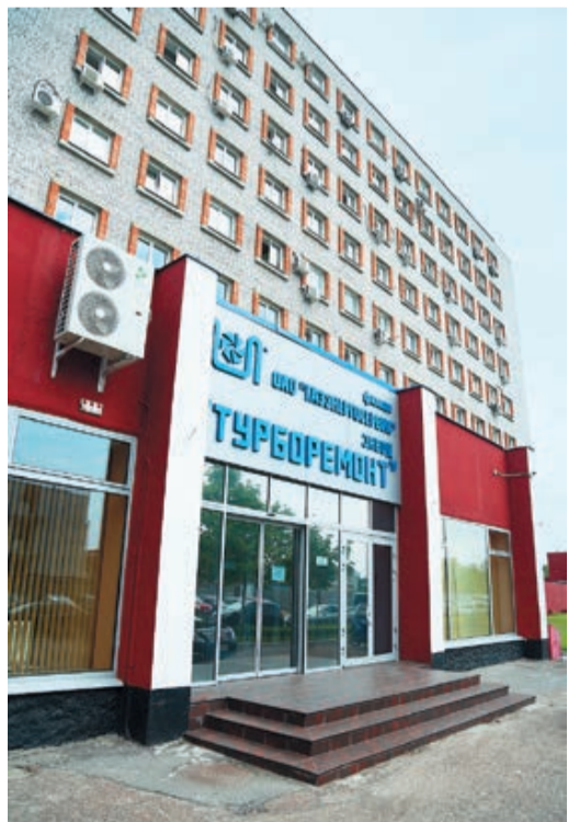
Филиал ОАО «Газэнергосервис» – завод «Турборемонт»