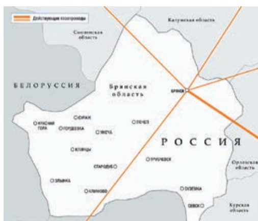
Магистральные газопроводы в Брянской области.