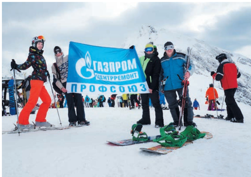
К покорению вершин готовы!

В конце февраля команда сотрудников ООО «Газпром центрремонт» – горнолыжников и сноубордистов – побывала на горнолыжных курортах Красной Поляны. Поездка была организована первичной профсоюзной организацией Общества.