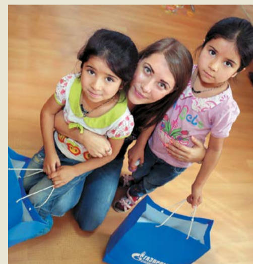
Никто из ребят не остался без подарка