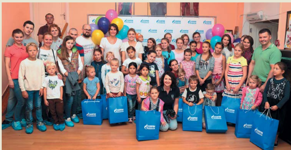
Участники акции «Сундук знаний»