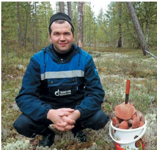
Знатный грибной «улов»

Вот и коллектив Надымского участка ПТУ «Надымгазремонт» очень сплочен. За многие годы работы люди привыкли смотреть в буду-