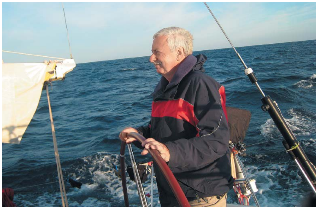
«Капитан, капитан, улыбнитесь!»