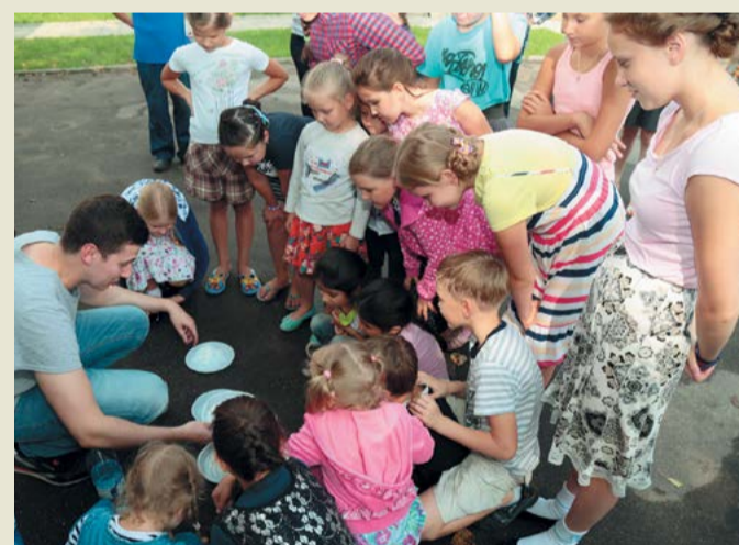
Химия – самая удивительная из наук