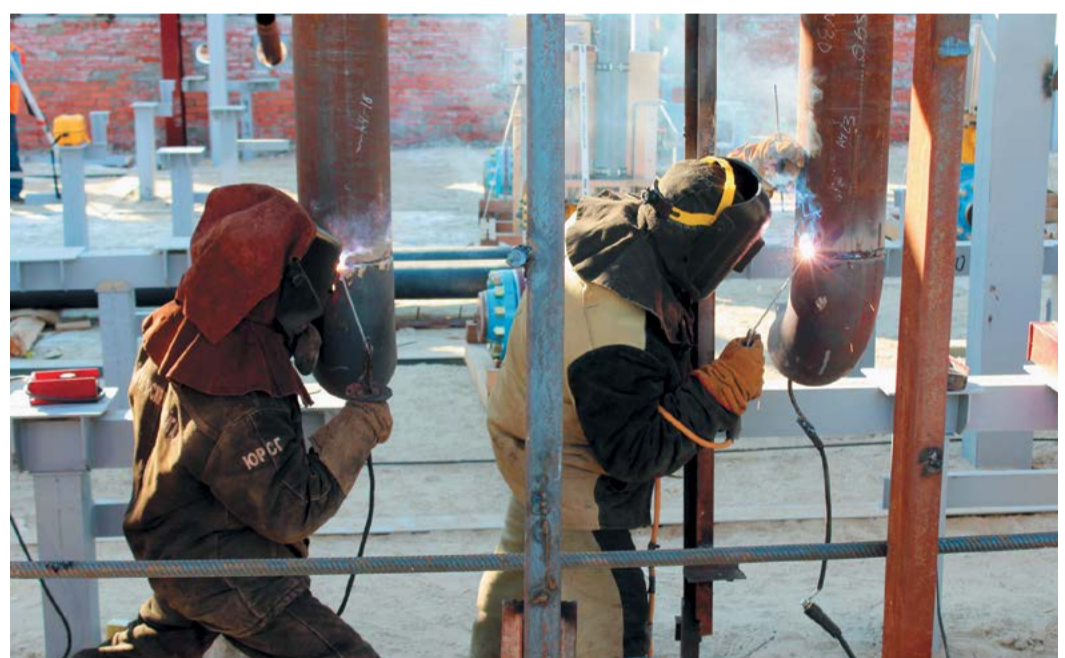
Обязка технологического оборудования