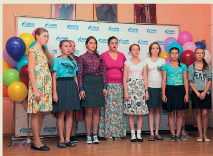
Хор воспитанниц приюта «Покров»