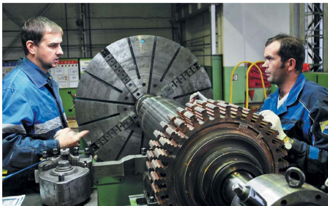
Идет восстановление рабочих поверхностей роторов турбин

ПТУ «Надымгазремонт» филиала «Югорский» АО «Центрэнергогаз» выполняет комплексные ремонты газоперекачивающих агрегатов, энергетического и технологического оборудования предприятий ПАО «Газпром», а именно – газоперекачивающих агрегатов, технологических трубопроводов, вспомогательного оборудования компрессорных станций, дожимных компрессорных станций газовых промыслов и оборудования станций охлаждения газа.