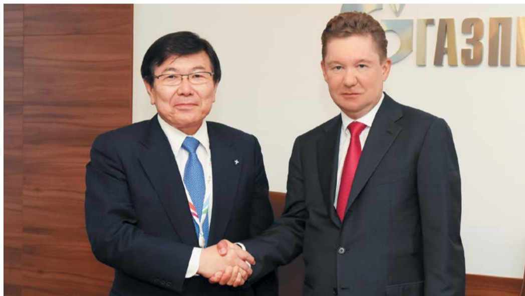
«Газпром» и Mitsui подписали Меморандум по сотрудничеству в рамках исследований в области СПГ-бункеровки

Что касается азиатского рынка, то переговоры с нашими партнерами по многим другим конечным продуктам нашего производства перешли в конкретную плоскость. Здесь важно отметить газомоторное топливо и переговоры со странами региона по строительству заводов СПГ, создание сети заправочных станций, а также – переговоры и перспективы по газовой генерации на базе поставок нашего газа. И, конечно, сжиженный природный газ, кроме трубопроводных поставок, – без сомнения, мы этому направлению нашей работы уделяли и будем уделять пристальное внимание. В частности, это проект третьей очереди «Сахалина-2». В прошлом году проектная