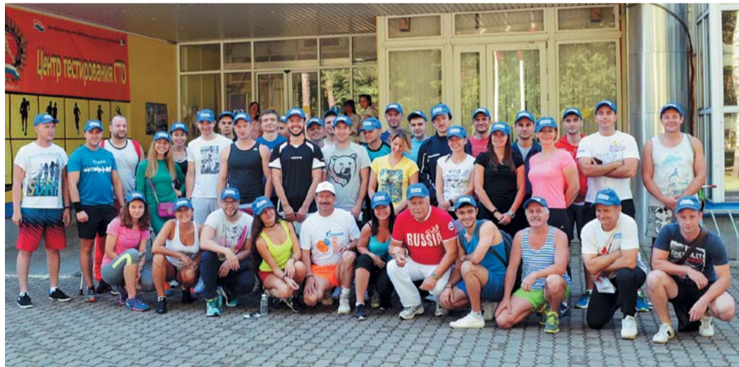
Участники сдачи норм ГТО ООО «Газпром центрремонт»

В последнюю субботу августа 39 работников компании «Газпром центрремонт» прошли тестирование по нормативам «Готов к труду и обороне» (ГТО). Мероприятие прошло при поддержке первичной профсоюзной организации Общества. Из числа принявших участие в сдаче нормативов 23 сотрудника получили золотой знак ГТО, 11 – серебряный знак и 3 работника – бронзовый.