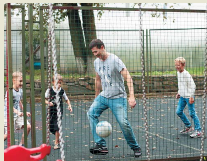
Футбольный матч в разгаре