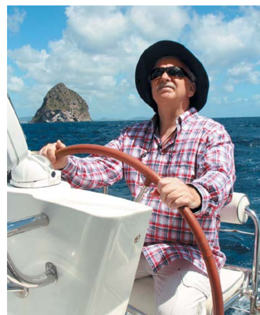
Курс – на новые впечатления