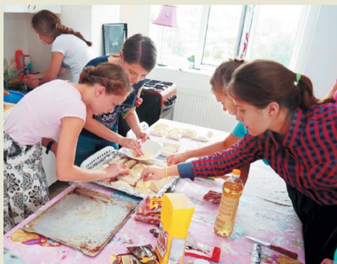
Мастер-класс по выпечке