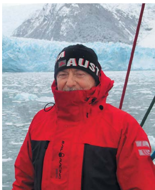
Южная Америка, пролив Бигл. 2014 г.