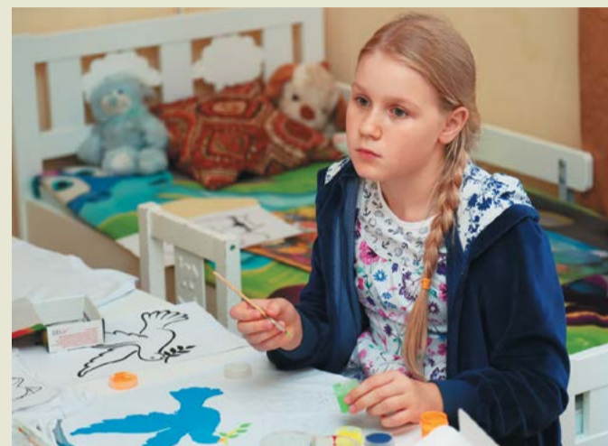
На футболки наносятся первые штрихи краской