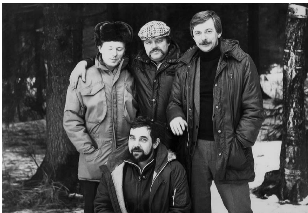
В дружной компании