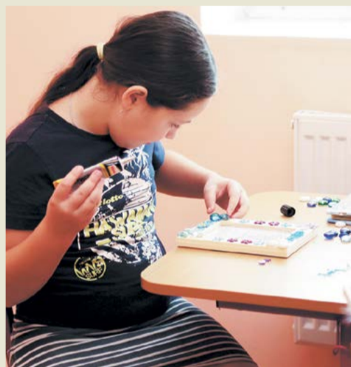
Изготовление декоративных фоторамок