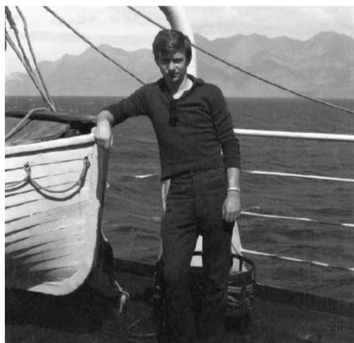
Практика в мореходке. 60-е годы