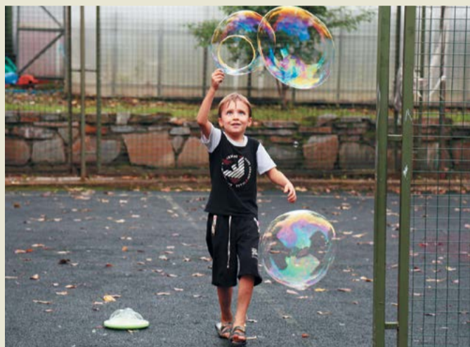
Мыльные пузыри – это всегда весело!