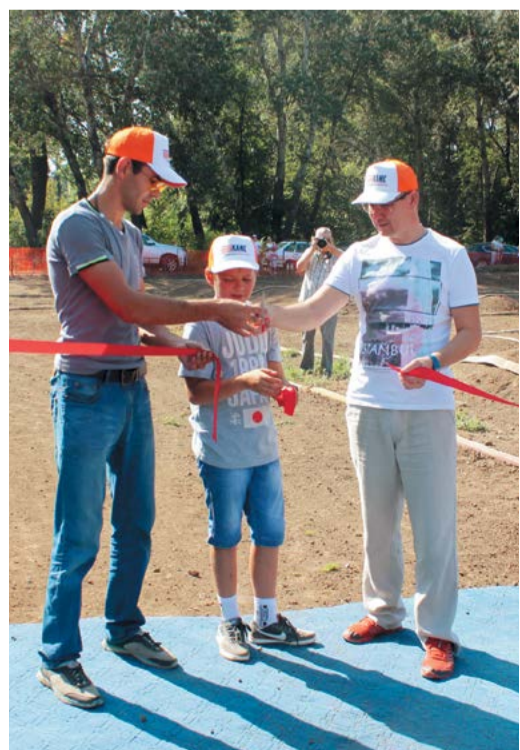
Волнующий момент открытия трассы

В Оренбурге по инициативе любителей автомобильного спорта и при поддержке ООО «Газпром подземремонт Оренбург» на базе спортивно-оздоровительного комплекса «Зауральная роща» появился уникальный спортивный объект – off-road-трасса для моделей внедорожников и гоночных автомобилей масштабов 1 : 10 и 1 : 8 «Евразия. RCRaceway».