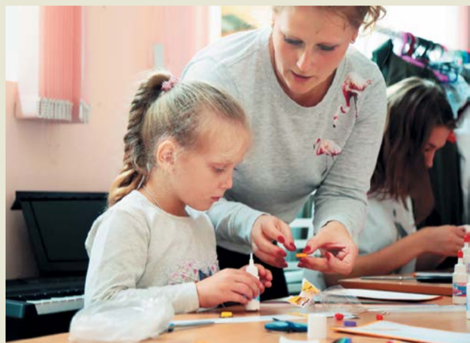
Квиллинг – дело мудреное, но интересное