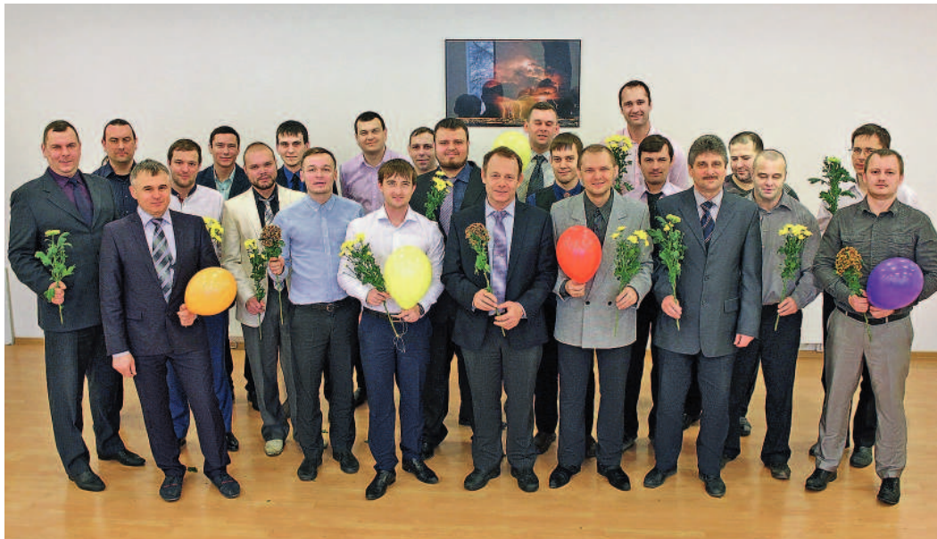
...от коллектива завода ОАО «Электроцит»