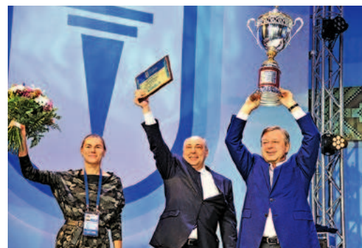
ООО «Газпром трансгаз Сургут» — обладатели места во взрослой категории