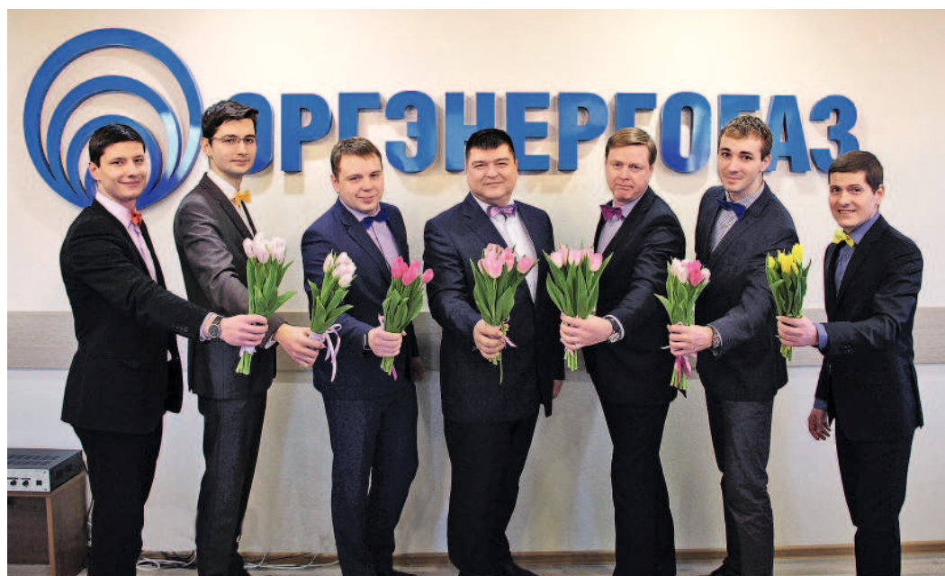
...от коллектива ОАО «Оргэнергогаз»