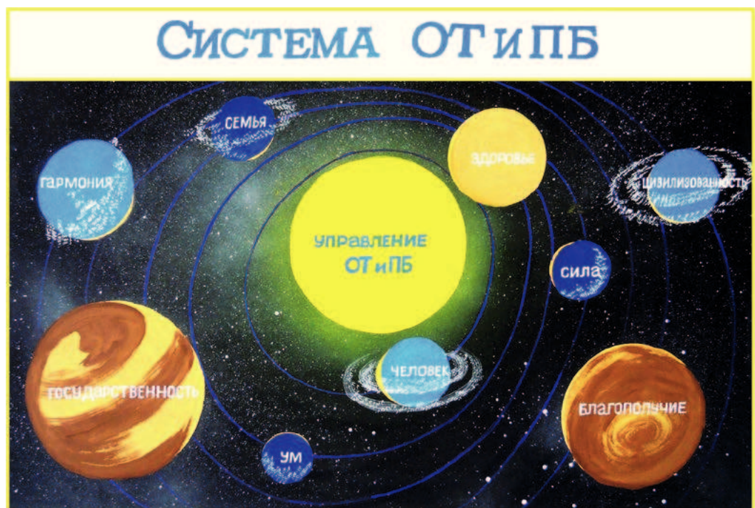
Плакат серии «Система ОТ и ПБ» авторства семьи Непобедимовых