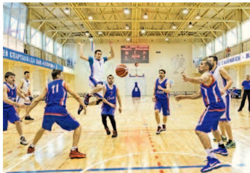
Соревнования по баскетболу