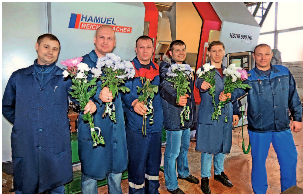
...от коллектива цеха турбинных лопаток филиала ОАО «Газэнергосервис» — завода «РТО»