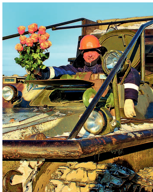
...от водителя Управления механизации строительства ООО «Югорскремстройгаз» Виталия Гондаря