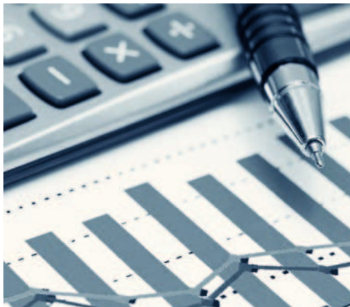
В основе всего — эффективное управление затратами

Организован четкий контроль на всех этапах проведения конкурентных процедур — от подтверждения необходимости проведения закупки и контроля ее начальной (максимальной) цены до принятия решения об итоговой стоимости приобретаемых товаров (работ и услуг). Результаты закупок учитываются в дальнейшем при формировании и корректировке бюджетов