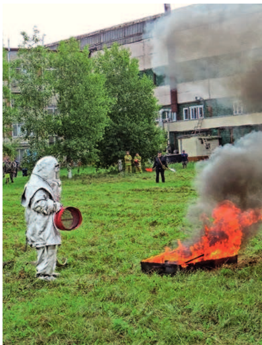
Тренировка на производственной площадке АО «Тюменские моторостроители»

Согласно действующему законодательству Российской Федерации, в каждой крупной компании должны быть созданы подразделения, курирующие направления работы в области гражданской обороны и защиты от чрезвычайных ситуаций. В ООО «Газпром центрремонт» эти функции возложены на специальный отдел — постоянно действующий орган управления корпоративной системы гражданской защиты ПАО «Газпром».