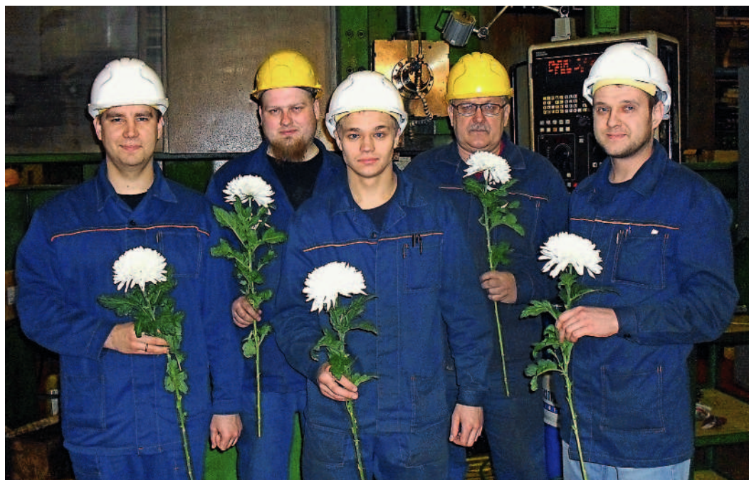
...от коллектива филиала ОАО «Газэнергосервис» — завода «Турборемонт»