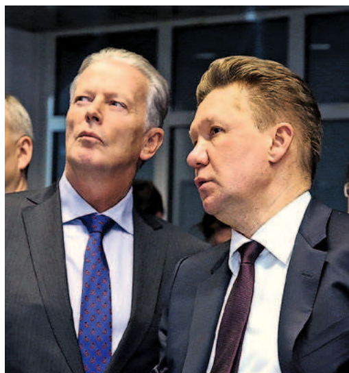
Райнхольд Миттерленер и Алексей Миллер

В центральном офисе ПАО «Газпром» состоялась рабочая встреча Председателя Правления Алексея Миллера и Вице-канцлера Австрии Райнхольда Миттерленера.