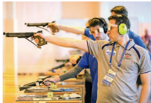
Точно в цель!