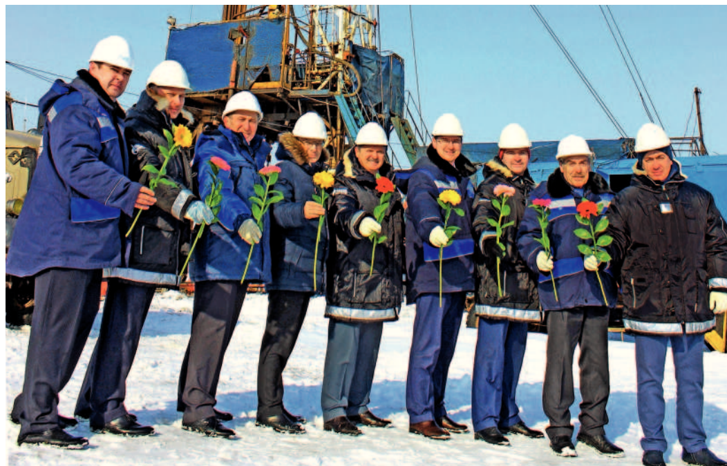
...от сотрудников Администрации и Оренбургского УИРС ООО «Газпром подземремонт Оренбург»