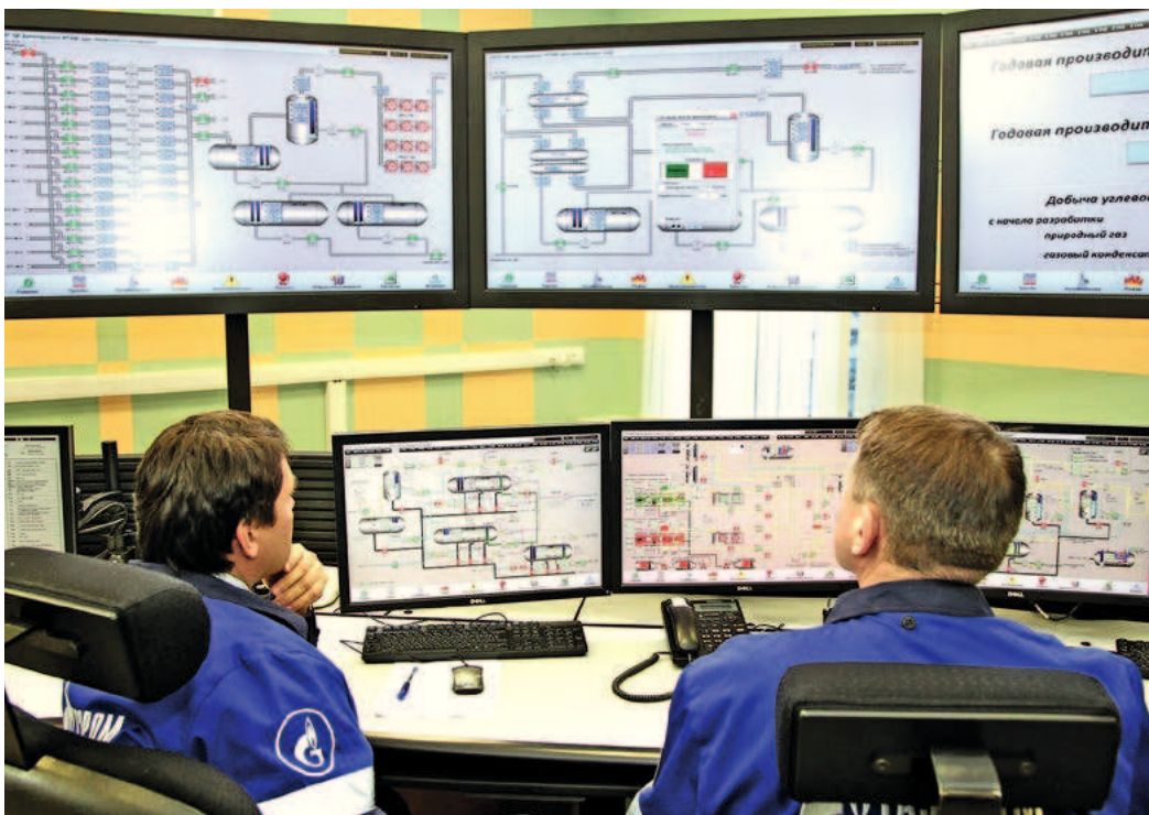
НИОКР — перспективное направление деятельности «Газпрома»

компаний Группы «Газпром», а исполнение заключенных договоров тщательно контролируется.