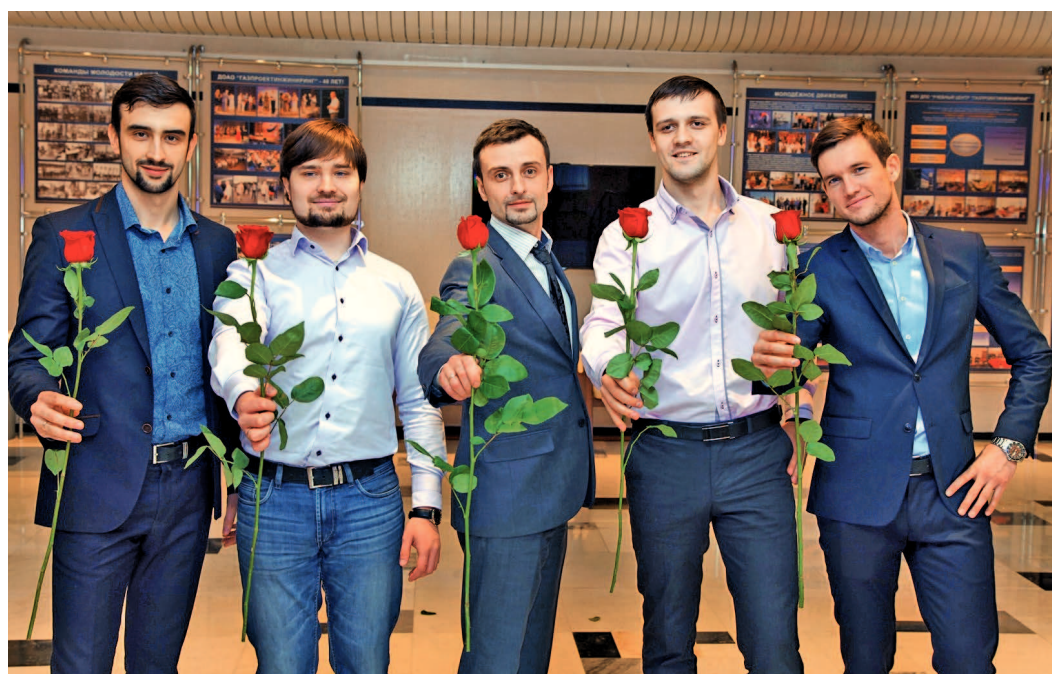
...от представителей Совета молодежи ДОО «Газпроектинжиниринг»