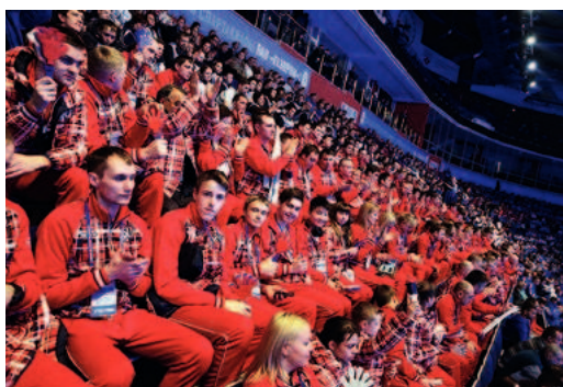
Спартакиада собрала порядка 2000 спортсменов дочерних обществ ПАО «Газпром»