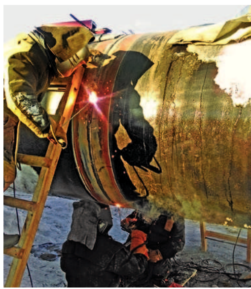
Идет сварка первых стыков