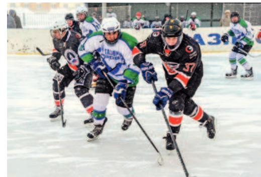
«Горячий лед» матча по хоккею