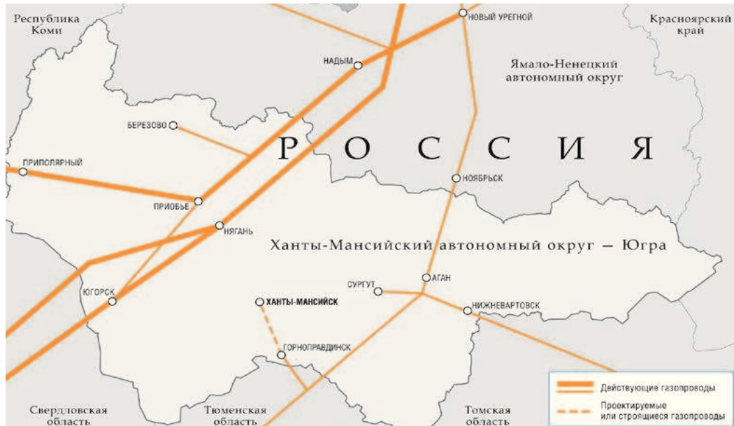
Система магистральных газопроводов ХМАО

Между правительством ХМАО-Югра и ПАО «Газпром» реализуются мероприятия