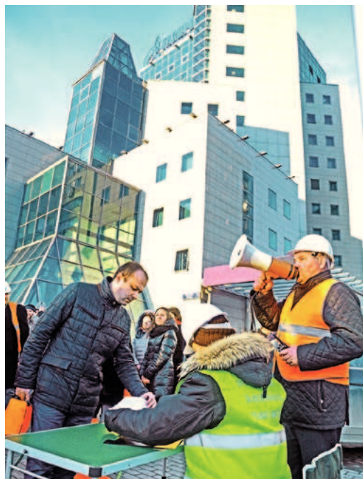
В ходе тренировки по экстренной эвакуации. Центральный офис ООО «Газпром центрремонт»

Среди ключевых задач специального отдела Общества — разработка тактических методик и планов действий при возникновении любого вида чрезвычайных ситуаций (пожар, теракт, техногенная катастрофа и ряд других) и максимальное предупреждение последних, контроль соблюдения норм безопасности, подготовка сотрудников к нештатным ситуациям, а также защита материальных ценностей предприятия. Однако главная ценность, которую призван защищать коллектив специального отдела, — жизни работников, которые могут быть потенциально подвержены опасности из-за несоблюдения установленных норм и правил.