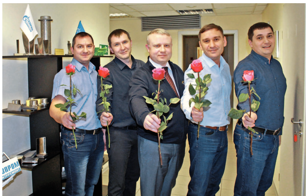
...от коллектива ОАО «Газэнергосервис»