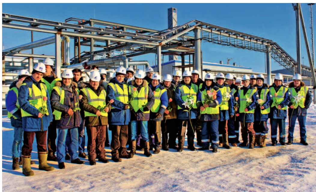
...от инженерно-технического персонала ООО «Югорскремстройгаз»