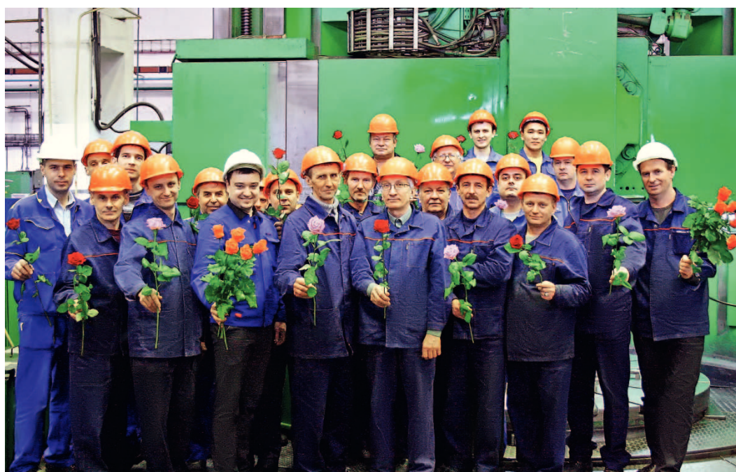
...от коллектива филиала ОАО «Газэнергосервис» — завода «Ротор»