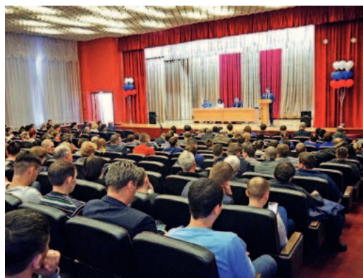
В ходе конференции

18 февраля в АО «Тюменские моторостроители» прошла конференция работников Общества, главной темой которой стало обсуждение итогов выполнения Коллективного договора предприятия за 2015 год.