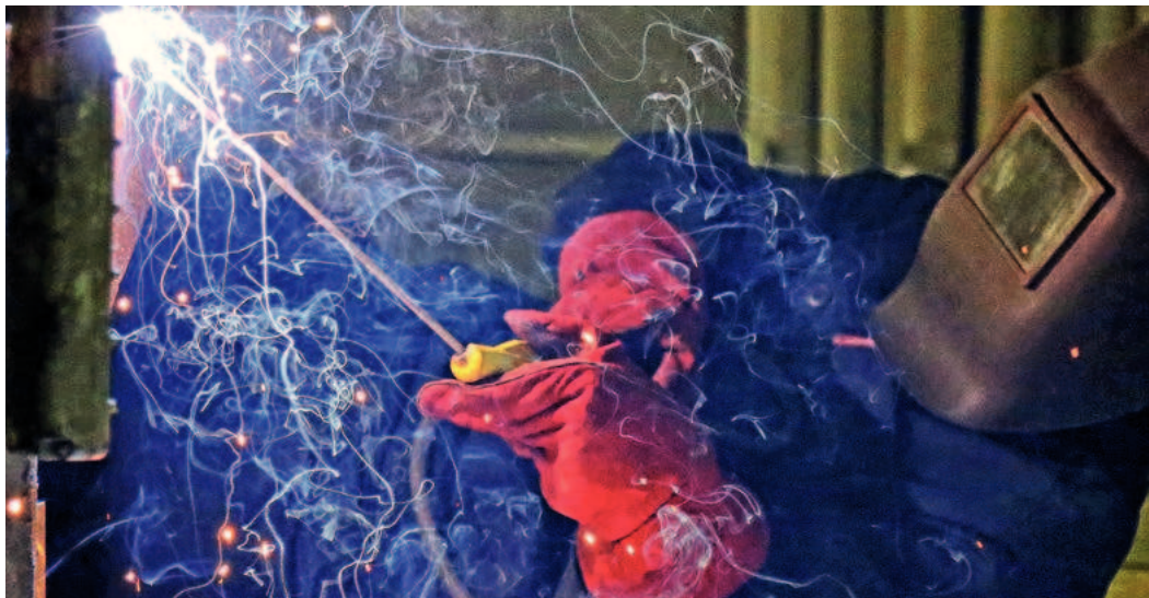
Безопасность труда — в приоритете

В ООО «Газпром центрремонт» безопасность труда также является основополагающим элементом эффективного управления производством. В рамках Года охраны труда, объявленного ПАО «Газпром» в текущем году, на предприятиях холдинга ООО «Газпром центрремонт» пройдет целый ряд тематических мероприятий.