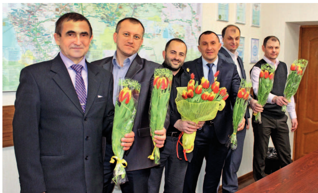
...от административно-управленческого персонала филиала «Афизэлектрогаз» АО «Газпром электрогаз»