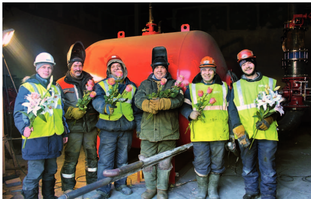
...от бригады сварщиков ООО «Югорскремстройгаз»