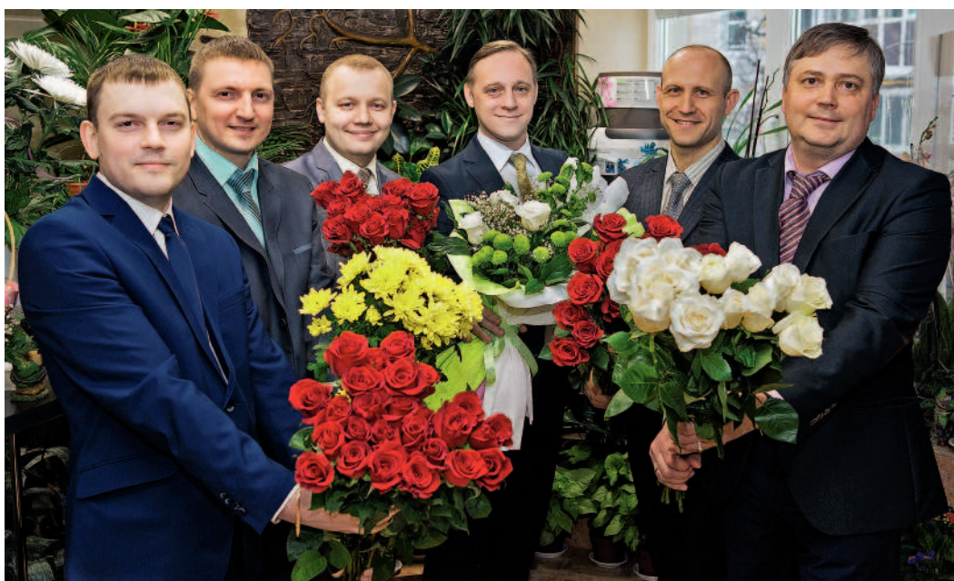
...от коллектива филиала «Югорский» АО «Центрэнергогаз»