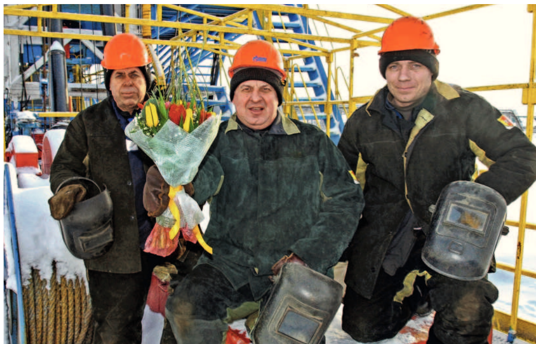
...от бригады сварщиков Уренгойского УИРС ООО «Газпром подземремонт Уренгой»