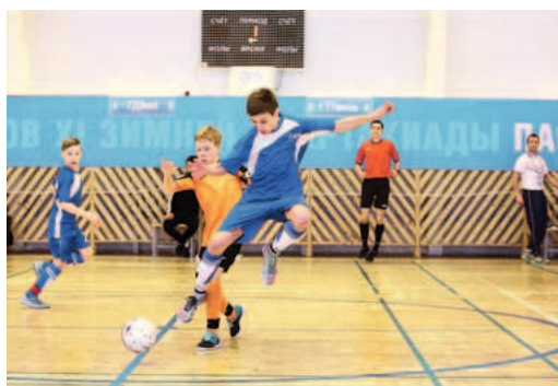
К победе — как на крыльях...