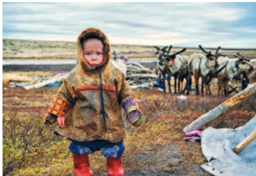
Жители округа живут в гармонии с природой

Ханты-Мансийский автономный округ — Югра для работников «Газпрома» — один из символов газодобывающей мощи России, занимающий одно из ведущих мест в нашей стране по добыче газа и нефти. Кроме того, в округе располагается целый ряд подразделений компаний Холдинга «Газпром центрремонт», задача которых в обеспечении бесперебойной работы объектов системы газоснабжения России.