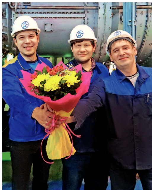
...от сотрудников цеха 29 АО «Тюменские моторостроители»