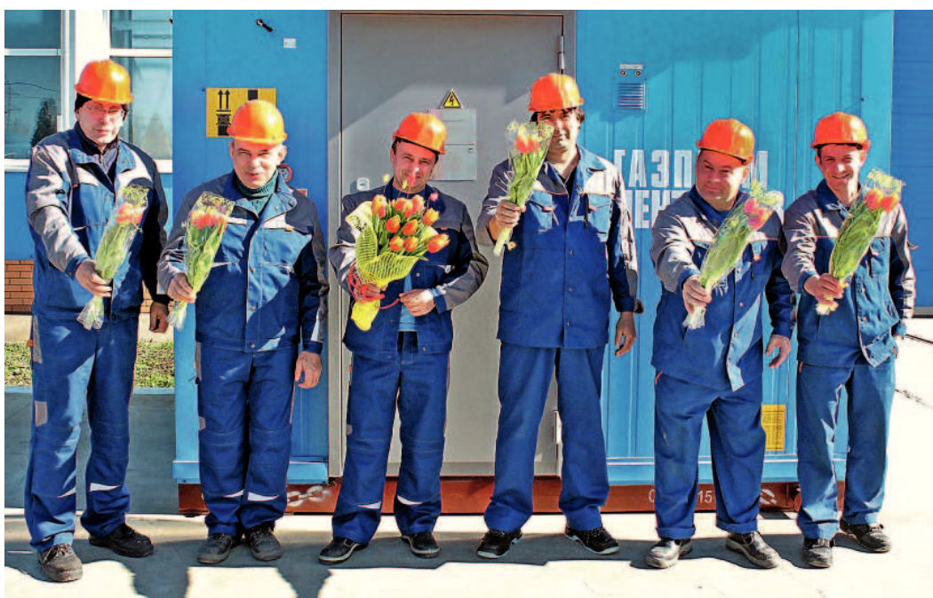
...от коллектива участка монтажа оборудования филиала «Афизэлектрогаз» АО «Газпром электрогаз»