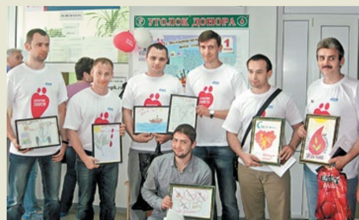
Благодарность сотрудникам завода «Турборемонт» от маленьких пациентов