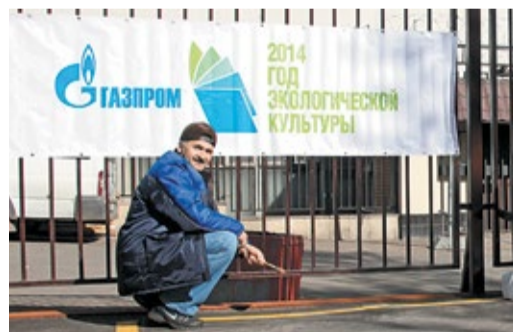
Благоустройство территорий в ОАО «Оргэнергогаз»

рассказала будущим специалистам о значимости проведения природоохранных мероприятий в промышленности.