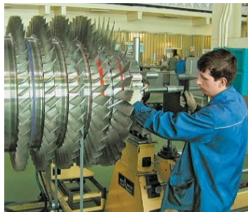
Балансировка ротора на площадке филиала ОАО «Газэнергосервис» – завода «Ротор»