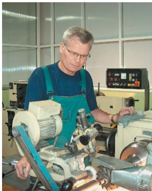
Процесс заточки фасонной фрезы в цехе филиала ОАО «Газэнергосервис» – завода «РТО»

Как было отмечено в ходе собрания, деятельность ОАО «Газэнергосервис» и в дальнейшем будет направлена на совершенствование производственного процесса за счет технологического перевооружения, а также внедрения передовых технологий, позволяющих расширять номенклатуру производства запасных частей и ремонта новых типов оборудования.