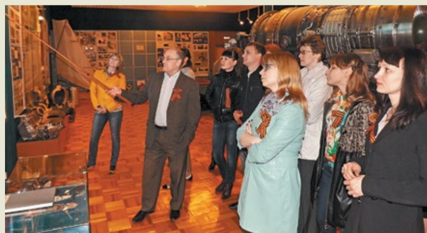
Вручение георгиевских ленточек в ОАО «Тюменские моторостроители» совместили с экскурсией в заводской музей