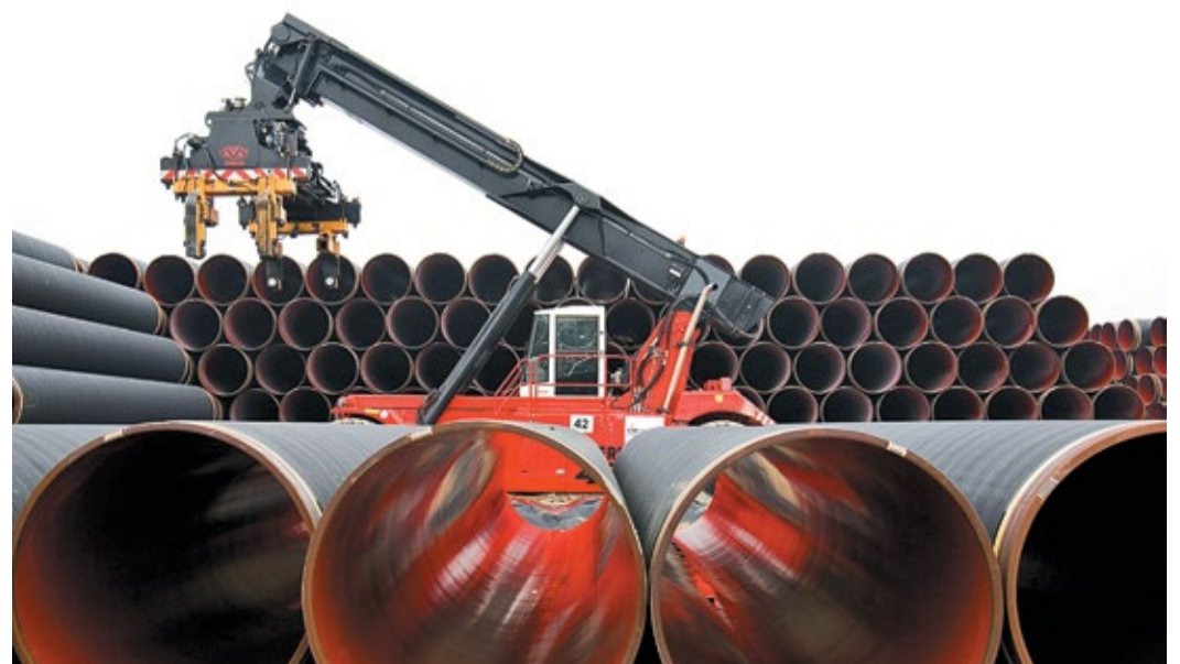
ОАО «Газпром» ведет активную работу по развитию ЕСГ

Екатерина ЯКОВЛЕВА