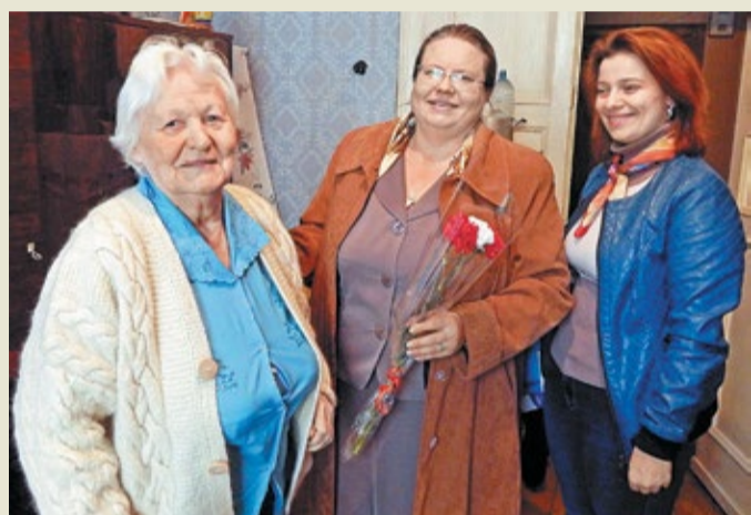
Работники ОАО «Газэнергосервис» – завода «Турбодеталь» в гостях у ветерана