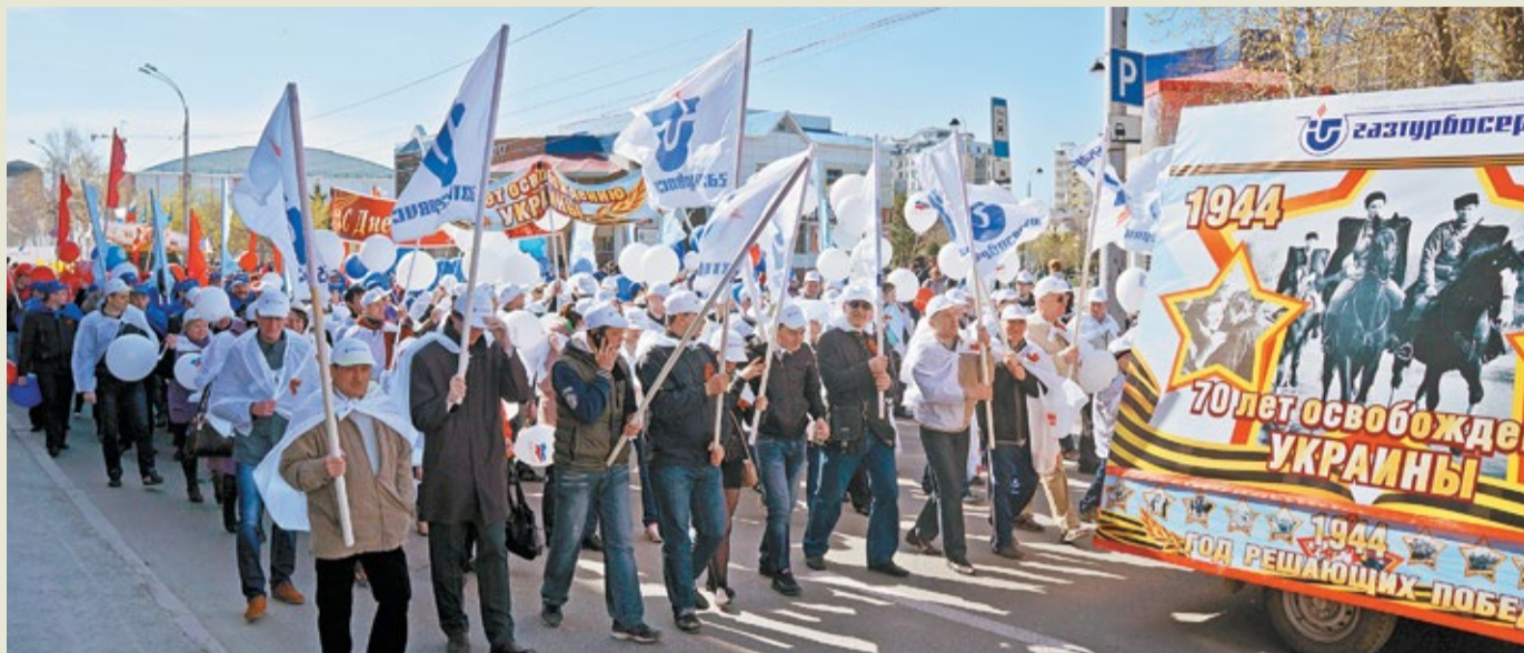
Праздничная колонна ПИИ ОАО «Газтурбосервис»