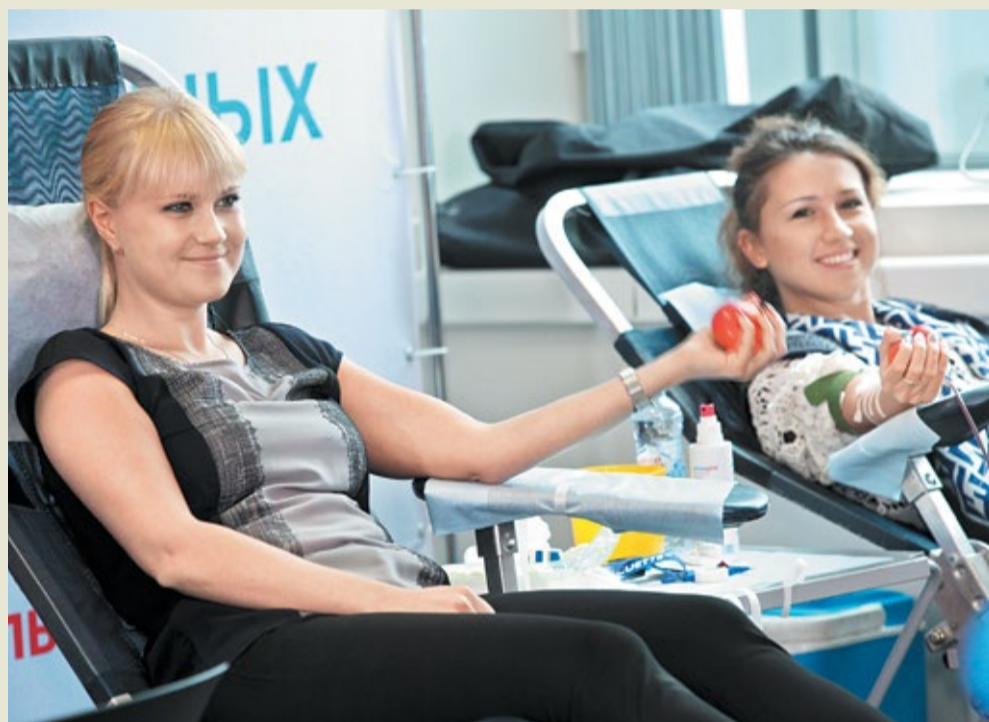
Донор знает, что здоров!