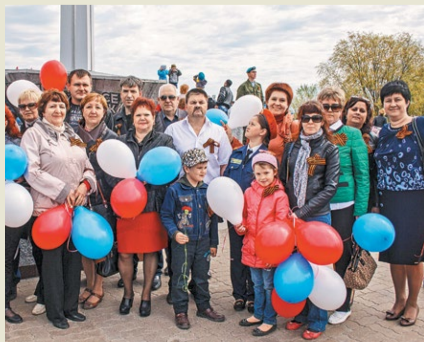
Коллектив филиала ОАО «Газэнергосервис» – завода «Ротор» на параде Победы