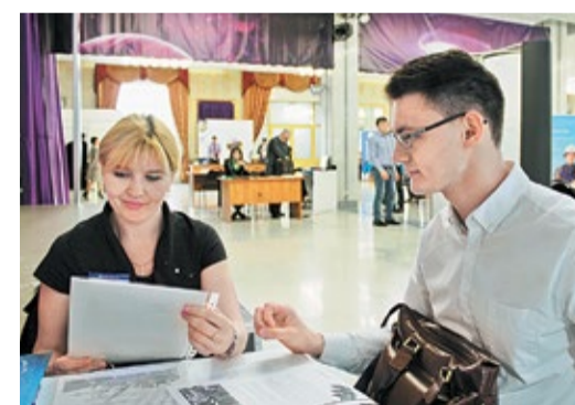
ОАО «Оргэнергогаз» привлекает молодежь