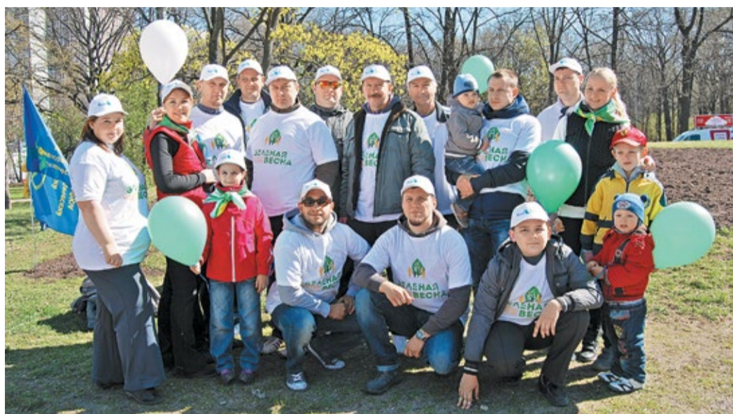
«Зеленая весна» в Воронцовском парке