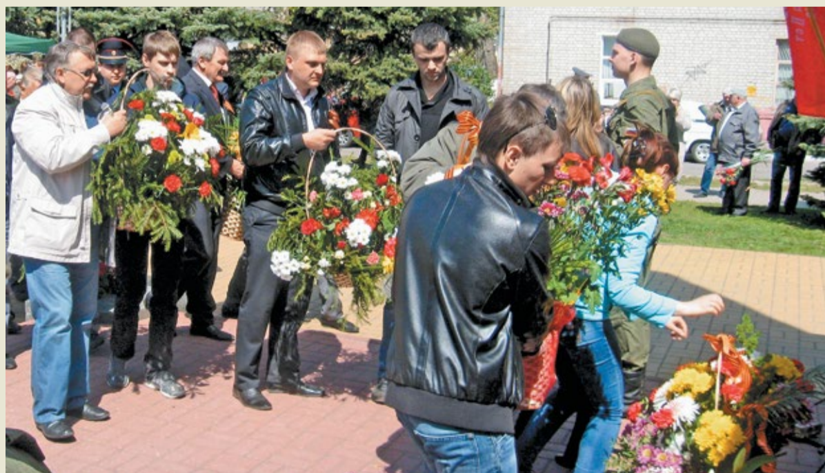
Сотрудники филиала ОАО «Газэнергосервис» – завода «Турборемонт» возложили цветы в память о погибших воинах