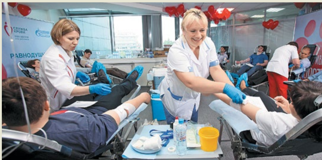
На сдачу крови – с хорошим настроением!