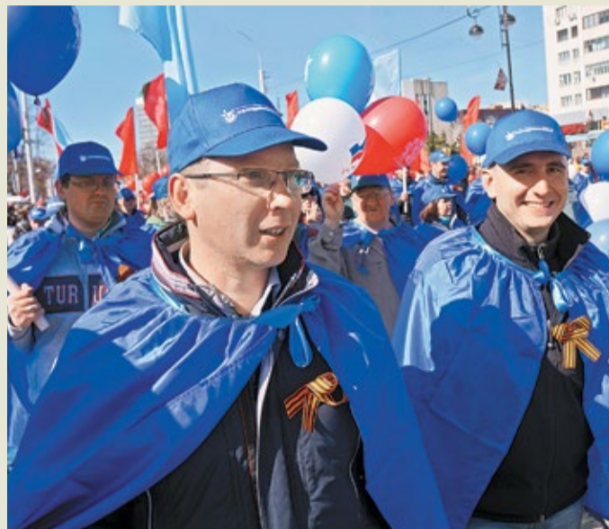
В День Победы – с боевым настроением!

митинги и церемонии возложения цветов к Вечному огню, с поздравлениями навещают бывших работников – ветеранов Великой Отечественной войны, украшают предприятия знаменами Победы и поздравительными плакатами. Кроме того, ООО «Газпром центрремонт» входит в Золотой список акции «Я помню! Я горжусь!», в рамках которой тысячи сотрудников предприятий Общества получили патриотический символ праздника – георгиевскую ленточку.