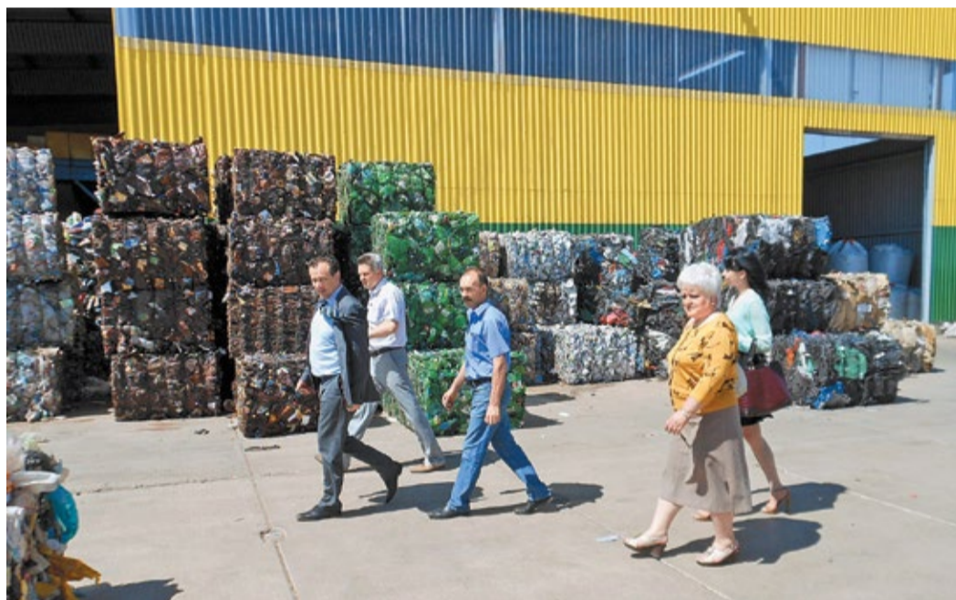
Сотрудники Оренбургского филиала ДАО «Центрэнергогаз» на мусороперерабатывающем заводе