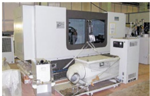
Зубошлифовальный станок Samputensili