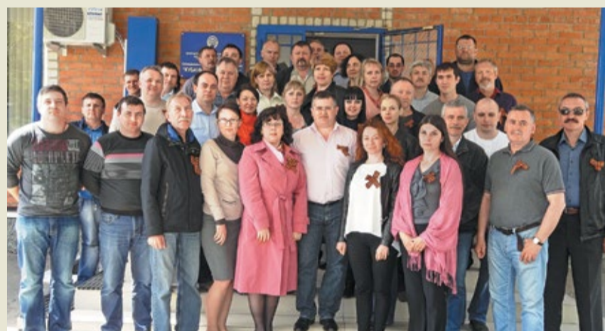
ПИИ ОАО «Газтурбосервис» к празднику готов!