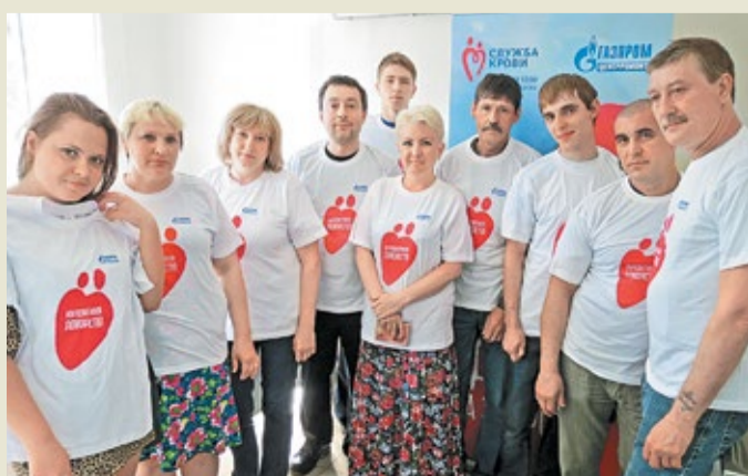
Коллектив филиала ОАО «Газэнергосервис» – завода «РТО»