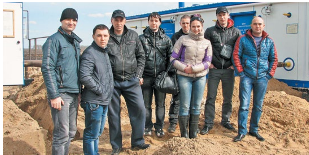
Участники программы обучения по ремонту ГРС

Специалисты Центра обучения кадров ДОО «Центрэнергогаз» разработали и опробовали на практике новый учебный план по программе профессиональной подготовки слесарей по ремонту технологических установок специализации «Техническое обслуживание и ремонт оборудования газораспределительных станций». По этой программе весной 2014 года была обучена первая группа рабочих филиала «Нижегородский» ДОО «Центрэнергогаз».