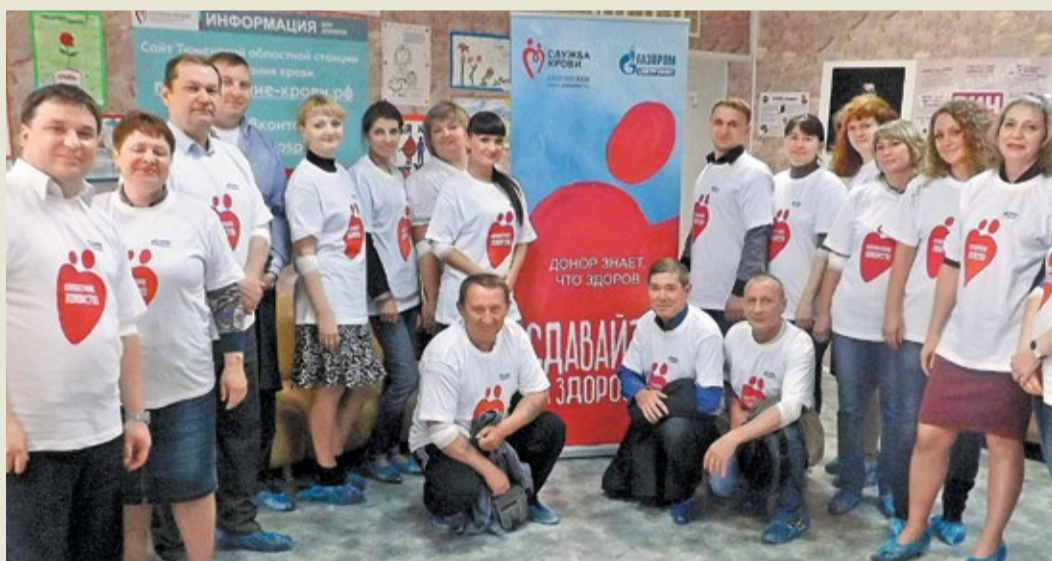
День донора в ОАО «Тюменские моторостроители»