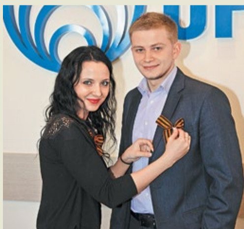
Акция «Георгиевская ленточка» в ОАО «Оргэнергогаз»