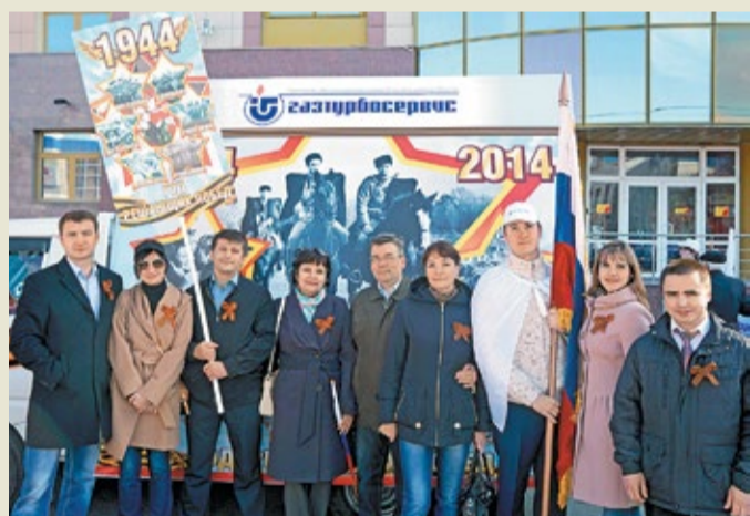
Коллектив СУ «Кубаньоргэнергогаз» в преддверии 9 Мая