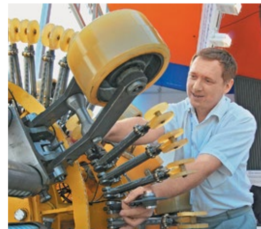
Демонстрация работы рычагов внутритрубного профилера «НПУ-1400» производства филиала «Саратоворганодиагностика»