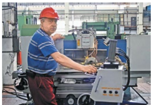
Универсально-фрезерный станок FTU-1250