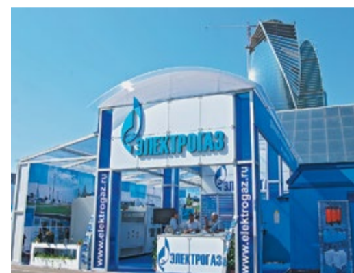
Стенд ДОО «Электрогаз» на выставке «Нефтегаз-2014»

По соседству с роботом на стенде расположился внутритрубный навигационный рычажно-ультразвуковой профилемер «НПУ-1400». Эта машина определяет планово-