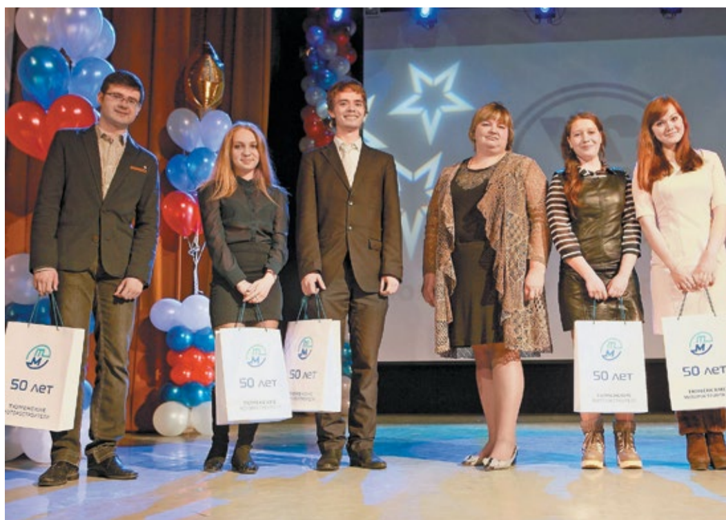
Подарки талантливой молодежи от ОАО «Тюменские моторостроители»