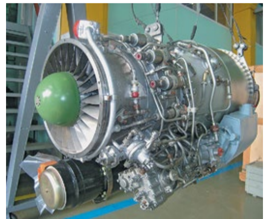
Авиационный турбореактивный двигатель РУ19А-300 в ОАО «Тюменские моторостроители»