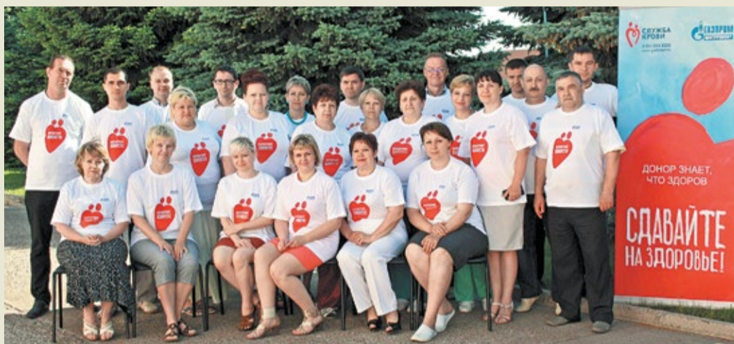
Доноры филиала ОАО «Газэнергосервис» – завода «Ротор»