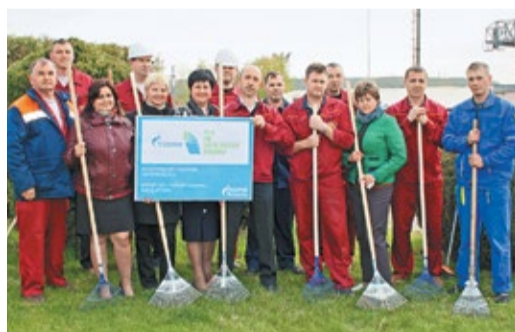
Работники завода «Ротор» на субботнике

Подобные мероприятия, направленные на экологическое просвещение, реализуются во всех компаниях холдинга. Также запланированы и творческие мероприятия – конкурсы для сотрудников и их детей на экологическую тематику и организация тематических выставок. Например, среди подразделений ОАО «Оргэнергогаз» планируется провести конкурс «Экологическая