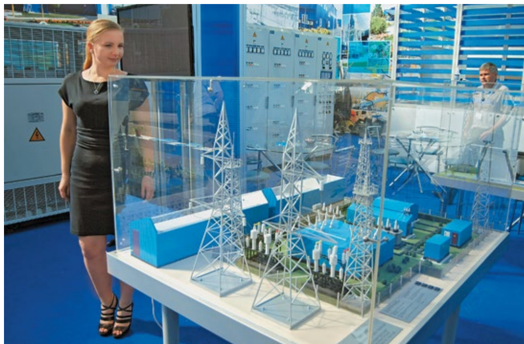
Масштабированная модель системы электроснабжения на стенде ДОО «Электрогаз»

Кроме того, ДОО «Электрогаз» в сотрудничестве с Управлением энергетики ОАО «Газпром» активно работает над созданием альтернативных источников энергии. На выставке был представлен макет электростанций с использованием солнечных модулей и ветроэнергетической установки. Сегодня в ООО «Газпром трансгаз Ставрополь» проходит опытная эксплуатация такого оборудования: основное электроснабжение дополняется источниками с солнечными модулями и генераторной установкой роторного типа. В этом году начато изготовление БКЭС «Астра», в котором альтернативные источники электроэнергии будут применяться в качестве основных, а возможно и единственных, источников электроснабжения. Конкретная площадка для апробации еще не определена, но в ДОО «Электрогаз» не исключают, что это может быть один из газовых объектов Республики Крым – там подходящий климат: солнечно и ветрено.