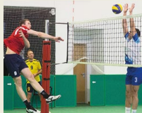
Удар от всей души