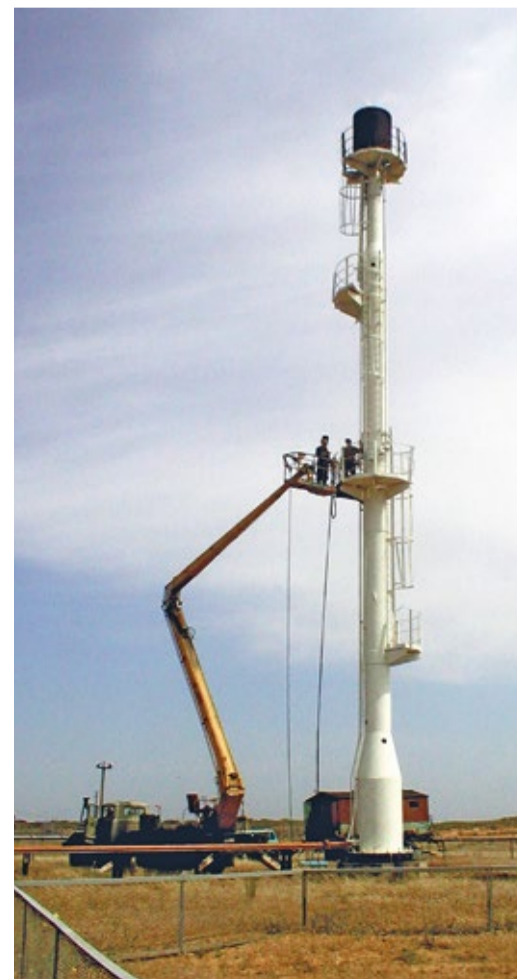
Ремонт факельной установки ООО «Газпром добыча Астрахань»