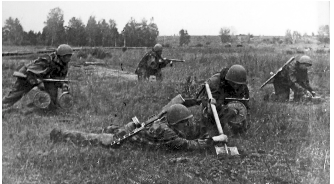
Советские саперы устанавливают противотанковые мины перед передним краем обороны

Главная цель наступления фронта на нашем участке была взять город Орел. Но, не доходя до Орла, нашу дивизию остановили и повернули в западном направлении. В течение нескольких дней мы проходили по 60–70 км в сутки. На привале замертво падали на землю и засыпали на несколько часов. После подъема завтракали и снова двигались вперед, пока не дошли до реки Десны. Здесь мы стали готовиться к дальнейшему наступлению. Впереди были форсирование Десны, битва за Днепр, освобождение Киева и другие операции.