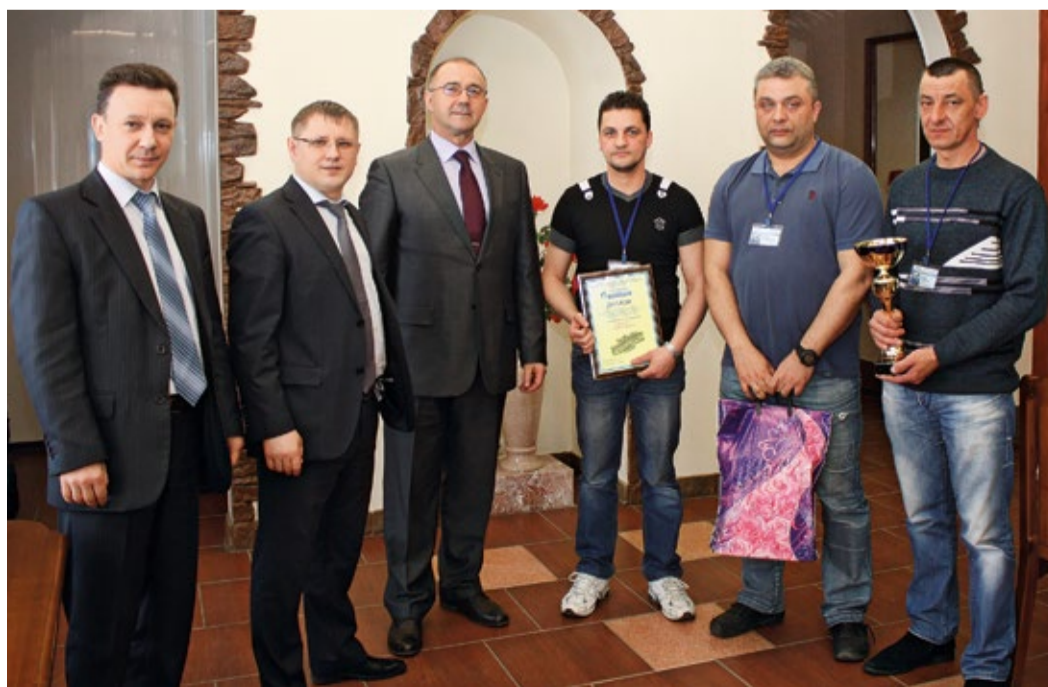
Награждение команды победителей