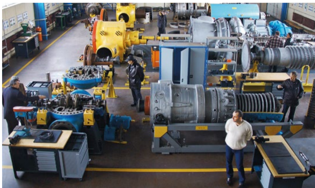
Учебный полигон Центра обучения кадров (ЦОК)