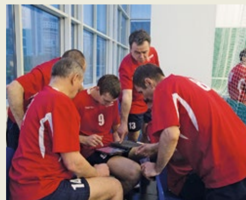
Обсуждение стратегии игры