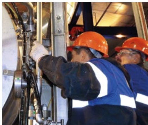
Работы на КС «Портовая»