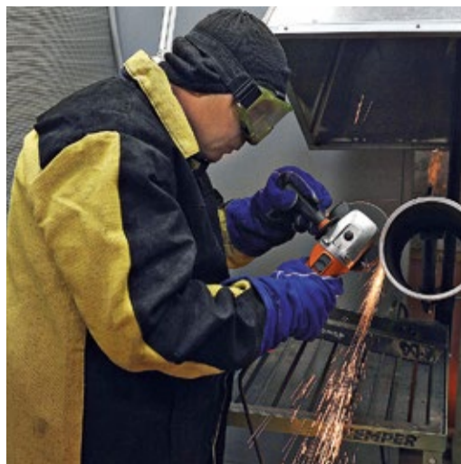
Практическое задание конкурса «Лучший сварщик» ДООАО «Центрэнергогаз»

Ключевая роль в развитии квалификации сотрудников и технологий ДООАО «Центрэнергогаз» отводится инженеринговым подразделениям Общества и холдинга ООО «Газпром центрремонт», а также Центру обучения кадров. При этом особое внимание мы по-прежнему уделяем и будем уделять качеству выполняемых ремонтных работ. ■