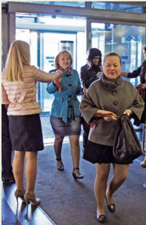
Георгиевская ленточка – каждому! Акция проходит на предприятиях холдинговой ремонтной компании ООО «Газпром центрремонт» пятый год подряд