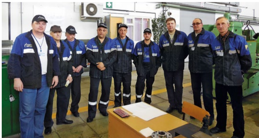
Конкурсанты перед началом практической части конкурса