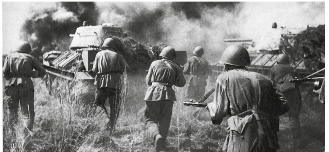
Танкисты во взаимодействии с пехотой контратакуют противника

Тяжелейшие бои продолжались около двух недель. На нашем участке немцам удалось продвинуться вглубь нашей обороны примерно на 15–20 км. Потом наступило затишье, и 15 июля наши войска перешли в контрнаступление. Проходя наши позиции в обратном порядке, мы увидели ужасные последствия этих боев. Усеянные трупами поля, десятки разбитых танков, сожженные дотла деревни, представлявшие собой одиноко торчащие трубы и погреба, в которых иногда прятались люди.