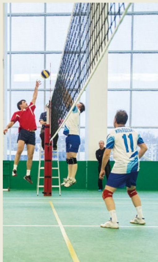
Борьба на высоте