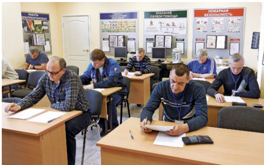
Выполнение теоретического задания