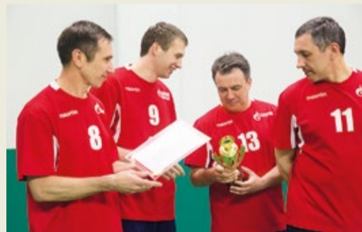
Награда нашла своих героев