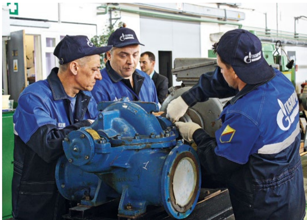
Командное выполнение центровки