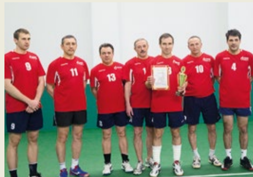
Сборная ООО «Газпром центрремонт» в полном составе