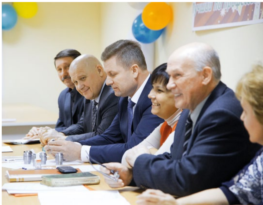
Конкурсная комиссия подводит итоги соревнования «Лучший по профессии»

Конкурс стартовал с выполнения практического задания. Участникам соревнований был выдан инструмент и чертежи деталей, которые им предстояло обработать механическим способом, продемонстрировав навыки токарной обработки уплотнителя и фрезерной обработки планки, а также нужно было самостоятель-