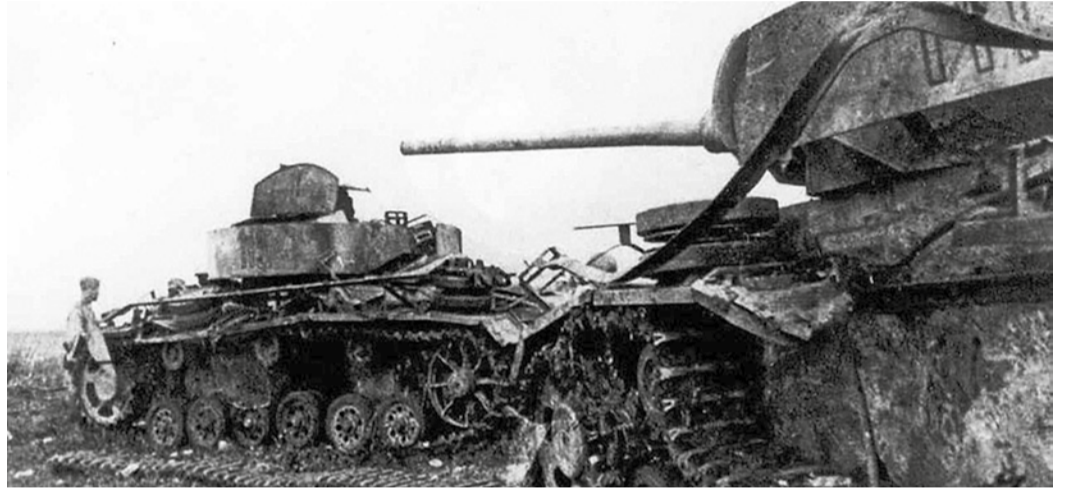
Подбитые немецкие танки, 1943 г.