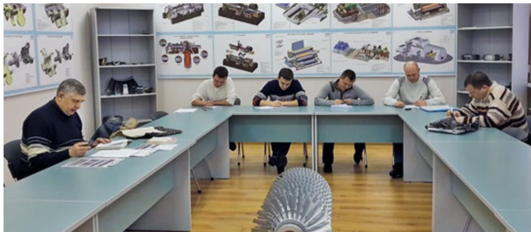
Аудитория ГПА и вспомогательного оборудования в ЦОК