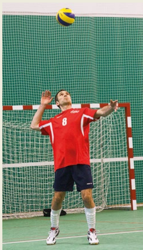
Победная подача капитана