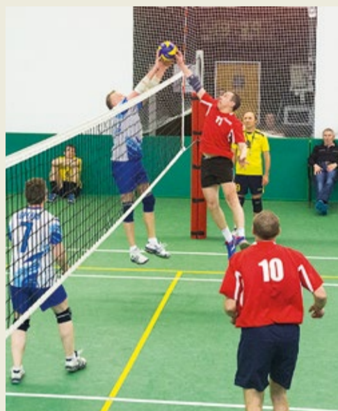
Враг не пройдет!