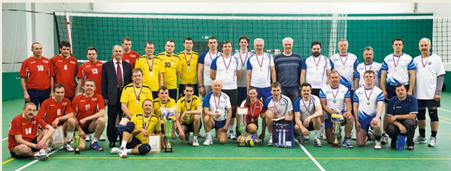
Команды — призеры турнира