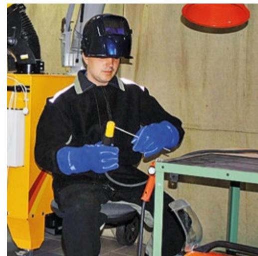
Подготовка рабочих ДООАО «Центрэнергогаз» по профессии «электросварщик»